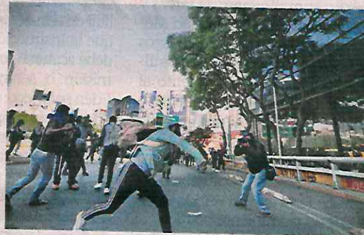
Los manifestantes lanzaron piedras y explosivos a los elementos de la policía.

Los manifestantes reprocharon que el extitular de la extinta Procuraduría General de la Repú-