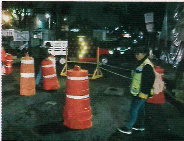
Miles de automovilistas resaltaron afectados por los trabajos fuera de horarios permitidos