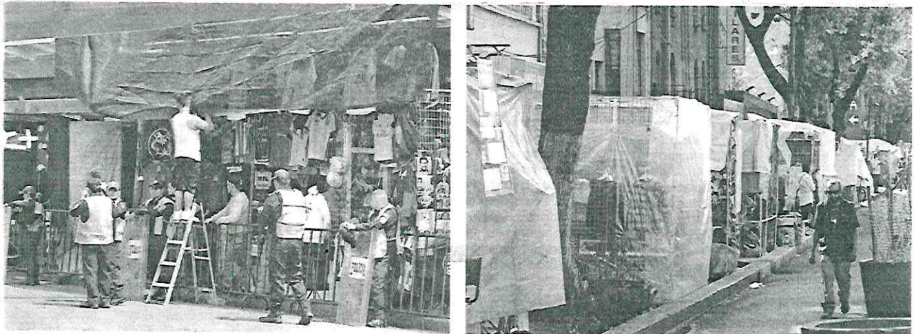
Ante el avance del crimen organizado que toman el lugar de comerciantes establecidos, se hace necesario la implementación de una ley que proteja a los comerciantes y frene la escalada criminal.