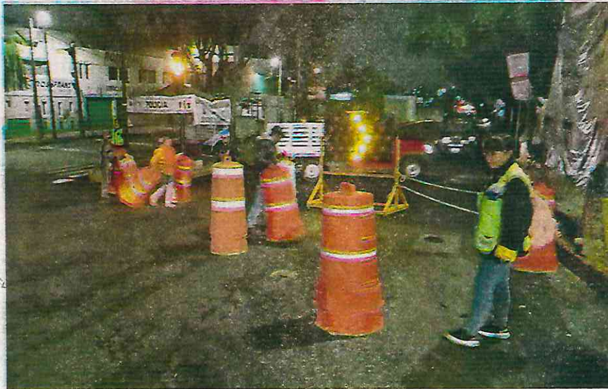
La avenida Luis Cabrera se vio afectada por la decisión arbitraria de la empresa de cerrar la vialidad en horas pico