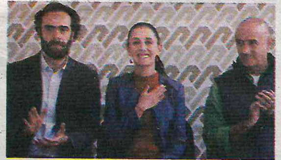
Con los titulares de Semovi y Sobse

Recordó que la planeación de este proyecto data de hace tres años, y que las pasadas administraciones no cumplían sus compromisos: “durante muchos años muchos gobiernos llegaban, prometían, después se iban y dejaban sin cumplir los compromisos que se hicieron, y no hay mayor satis-