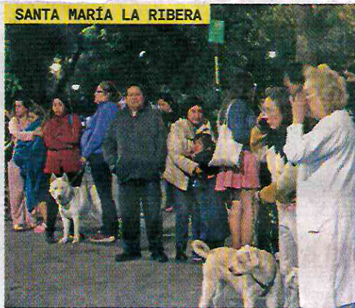
SANTA MARÍA LA RIBERA

Un temblor de magnitud 6.9, con epicentro en Coalcomán, Michoacán, se registró a la 1:16 horas de hoy y se sintió en la CDMX (fotos), Colima, Edomex, Hidalgo, Guanajuato, Guerrero, Jalisco, Morelos, Nayarit, Puebla y Querétaro. Autoridades capitalinas no reportaban daños, aunque una mujer murió al caer de las escaleras en su domicilio, en la Doctores. La alerta sísmica se activó con anticipación y permitió que se evacuaran inmuebles. En Michoacán no se reportaron afectaciones al cierre de esta edición.