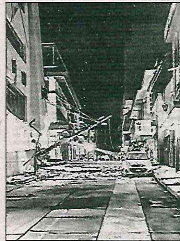
▲ Uruapan fue uno de los municipios más afectados.