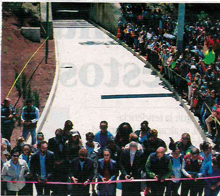
La Jefa de Gobierno de la CDMX, Claudia Sheinbaum, acompañó al alcalde de Cuajimalpa, Adrián Rubalcava, a inaugurar el paso a desnivel Chamixto.