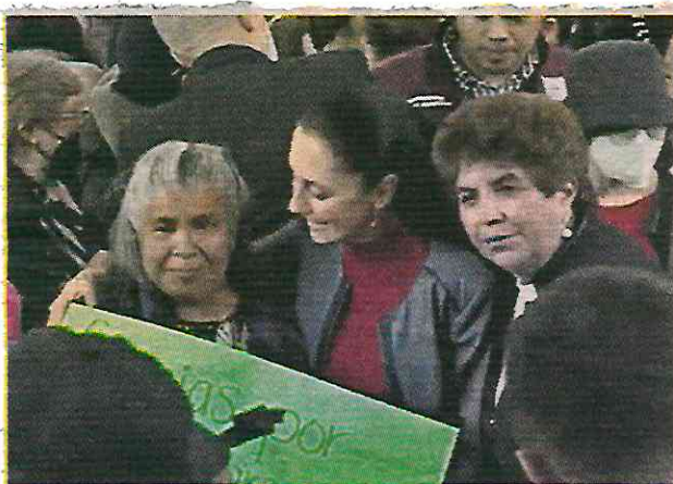
Muchos hasta del paso a desnivel se olvidaron.