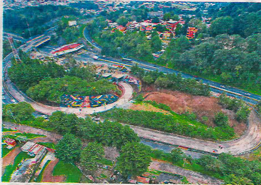
La obra tuvo una inversión de 85 millones de pesos con una longitud de 420 metros lineales, de los cuales casi 200 son de túnel