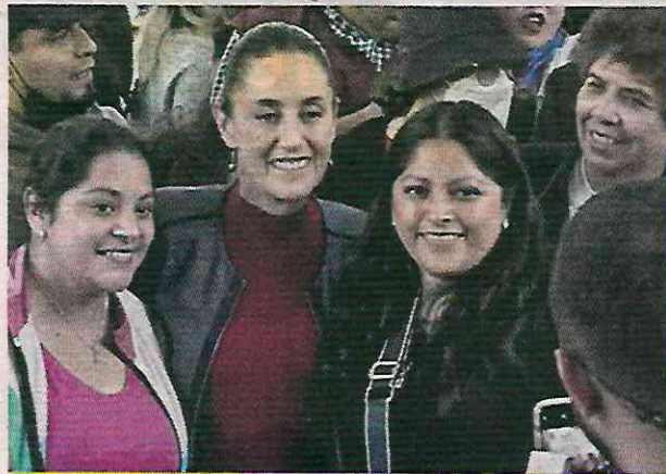
Bien apapachada estuvo la Mandataria capitalina.