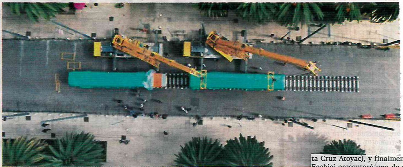
Todo listo para exhibición del nuevo Metro L1.

Durante cuatro días se exhibirá el convoy proveniente de China, así como otros transportes de la Red de movilidad Integrada en el Monumento a la Revolución