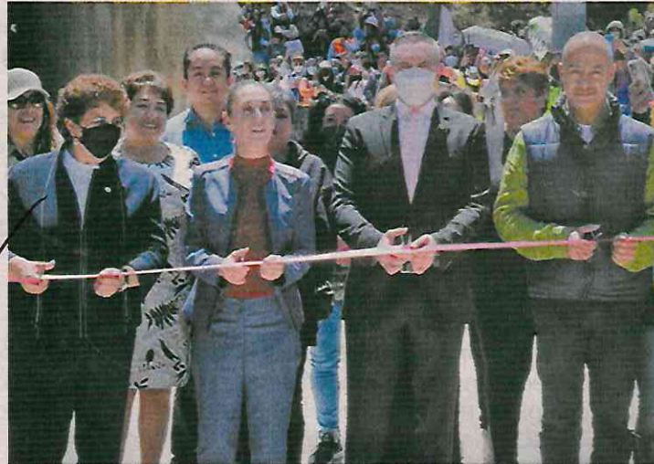
La jefa de Gobierno, Claudia Sheinbaum, y el alcalde Adrián Rubalcava encabezaron la inauguración del paso a desnivel Chamixto.

El alcalde agradeció a la mandataria que Cuajimalpa sea prio-