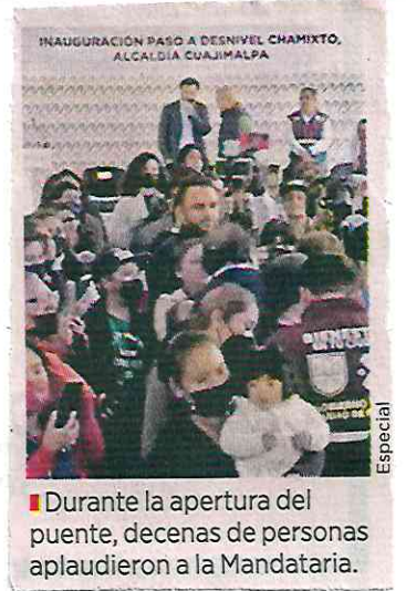
Durante la apertura del puente, decenas de personas aplaudieron a la Mandataria.

En la vida uno abre caminos, y uno abre caminos no solamente para uno, sino abre el camino para los demás, lo que queremos es abrir caminos para que nadie se quede atrás.