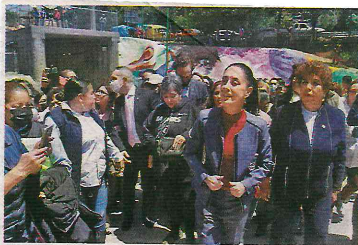
Corte de listón en la obra de Cuajimalpa.