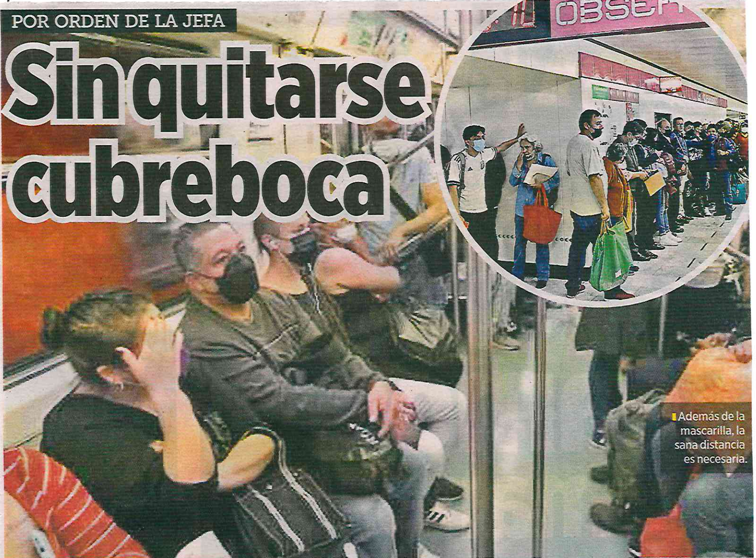
Además de la mascarilla, la sana distancia es necesaria.