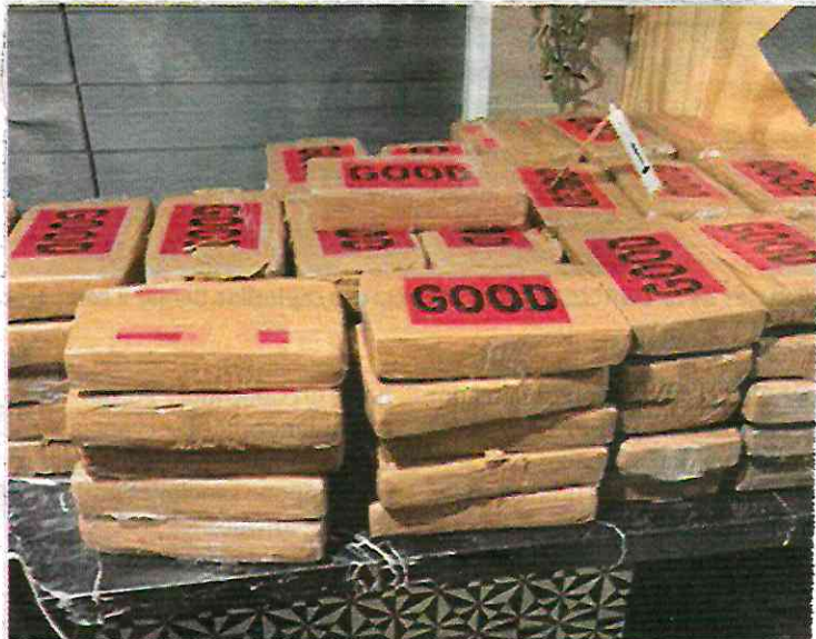
Durante los operativos se aseguraron 345 kilogramos de cocaína, seis vehículos, arma de fuego larga y 28 mil dólares.

“Las cuatro personas detenidas pertenecen a una célula delictiva dedicada al trasiego, almacenamiento, venta y distribución de drogas aquí en la Ciudad de México y hacia los Estados Unidos y otros estados del país, logrando asegurar 345 kilogramos de cocaína, seis vehículos, cuatro de ellos con compartimentos ocultos, 28 mil dólares americanos, un arma de fuego larga y diversos equipos telefónicos”, destacó el funcionario.