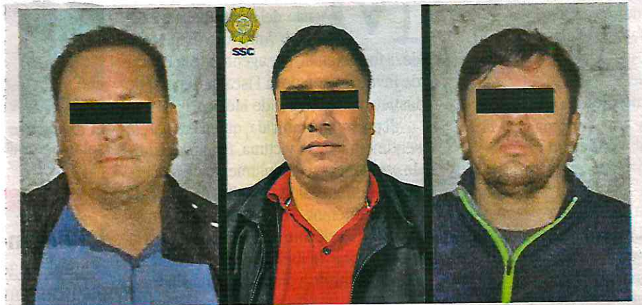
Cuatro presuntos integrantes del CJNG, tres de ellos en esta gráfica, fueron detenidos en diferentes operativos

Ese realizaba el trasiego de drogas hacia los estados de Milwaukee, Pittsburgh, Chicago, Denver, Virginia y Washington D.C., en los Estados Unidos, y es considerado como presunto responsable de almacenar, vender y distribuir grandes cantidades de droga proveniente de Colombia, a diversos grupos y/o células delictivas de la Ciudad de México.