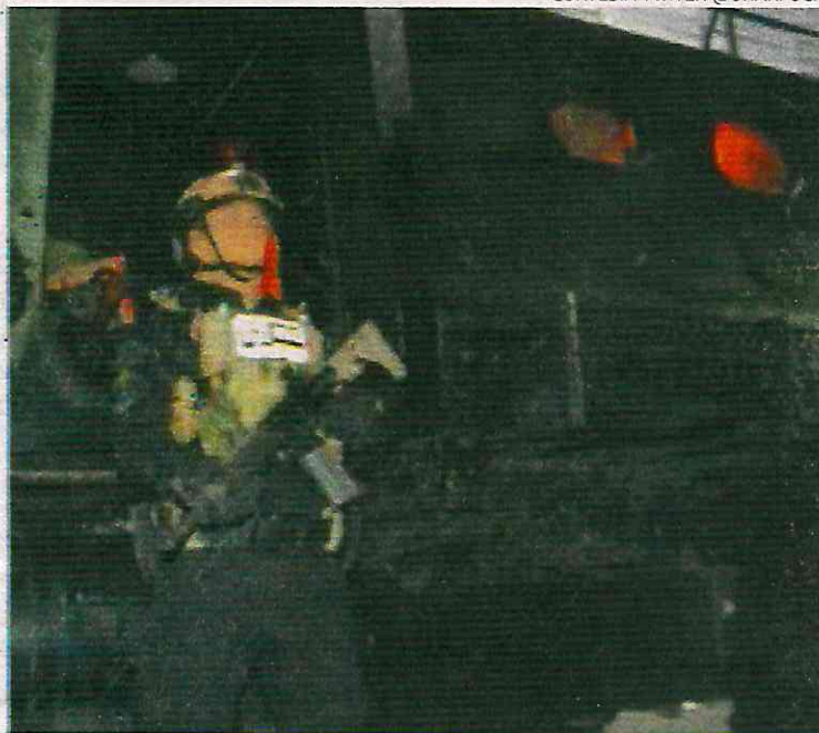
Policías reguardan el decomiso de los estupefacientes

Cae El Jalisco, líder de una banda dedicada al tráfico de estupefacientes hacia los Estados Unidos. También capturaron a otros tres