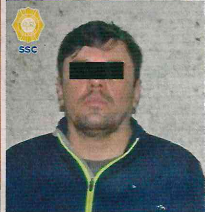
En un operativo realizado en la colonia Monte de Piedad, en la alcaldía Coyoacán, elementos de la policía capitalina capturaron a El Jalisquillo . Luego de tres cateos se aseguraron 345 kilos de cocaína y autos.