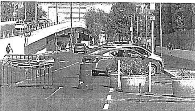
V. CARRANZA. Personal de la Cámara de Diputados confinó carriles viales de las calles Sidar y Roviroso para hacer de ellos un estacionamiento exclusivo. Con vallas, cinta plástica y hasta macetones se prohibió ayer el paso a los automovilistas.

y Palmatilla y 1 en senderos seguros de escuelas públicas. Otro fue realizado en Azcapotzalco, en la Colonia Progreso y uno más se llevó a cabo en Coyoacán el miércoles con la participación de Sheinbaum.