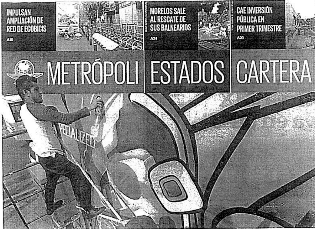
La fusión de elementos modernos con parte de las raíces del país genera que los artistas plásticos elaboren obras como ésta en el que un guerrero águila va en su bicicleta.