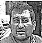
César Cravioto, Comisionado 19S

El documento promovido por la Comisión para la Reconstrucción prevé que Grupo Banorte financie una parte para la rehabilitación de 81 casas. El Gobierno capitalino aportará 15 millones de pesos y Banorte 10 millones de pesos", expuso el Comisionado 19S.