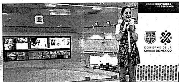
La jefa de gobierno de la CDMX, Claudia Sheinbaum Pardo, expuso que el C911E será un plan piloto, porque más adelante se ampliará a toda la urbe.

MIL PESOS pagarán los particulares por la conexión al C-5, más el precio de las cámaras de videovigilancia, que costarían entre los 60 mil pesos