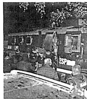
En un vehículo blindado fueron trasladados los detenidos

Integrantes de esta banda se les vincula con venta de droga, secuestro y extorsión