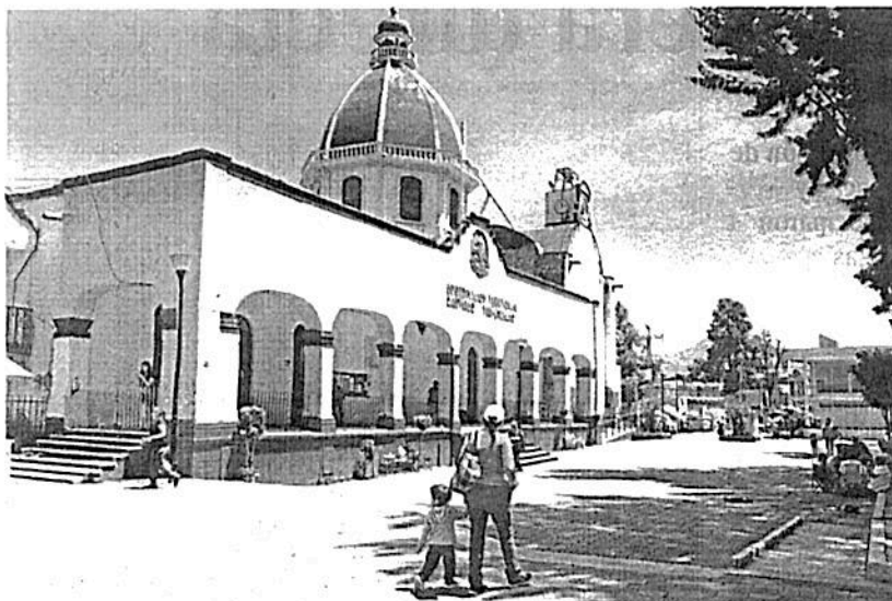
Tulyehualco es la zona más conflictiva de este corredor / ADRIAN VÁZQUEZ