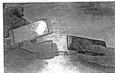
De acuerdo con cifras de Kaspersky Lab, en ataques por troyanos extorsionadores móviles, México es quinto lugar a nivel global.

"El troyano le exige una suma de dinero a la víctima a cambio de