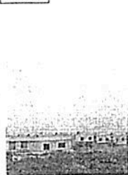
ambiente. Estaciones de monitoreo reportan mala calidad del aire en algunas zonas de Monterrey.