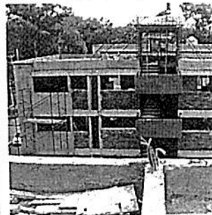
Dañificados del Multifamiliar Tlalpan evidenciaron un alza en los costos de los muebles de baño y ventanas.

de los Multifamiliares, que ya está un grupo de empresas revisoras, analizando toda la documentación de las empresas que están reconstruyendo los Multifamiliares para detectar cualquier anomalía.