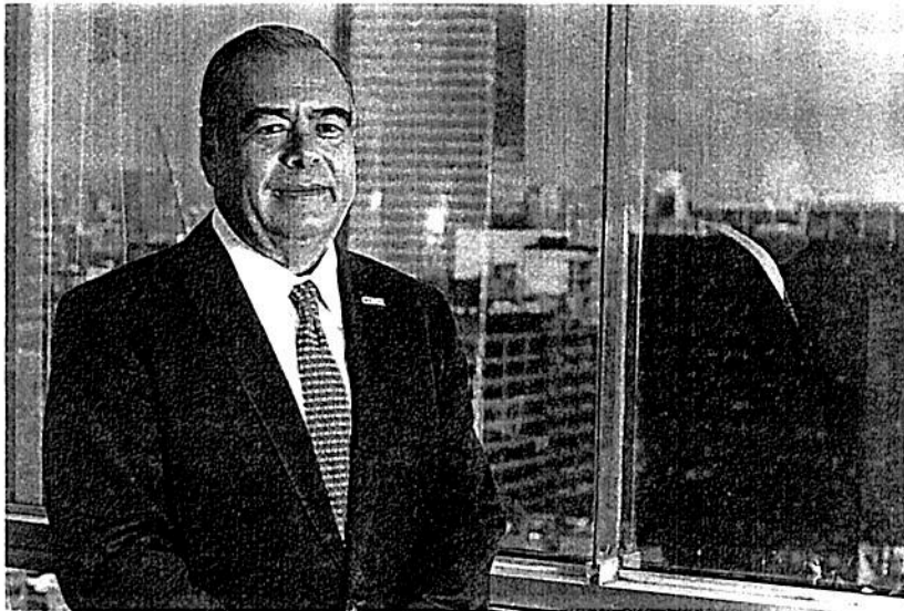
Se espera que el caso Collins continúe en los juzgados JULIÉS BRAVO