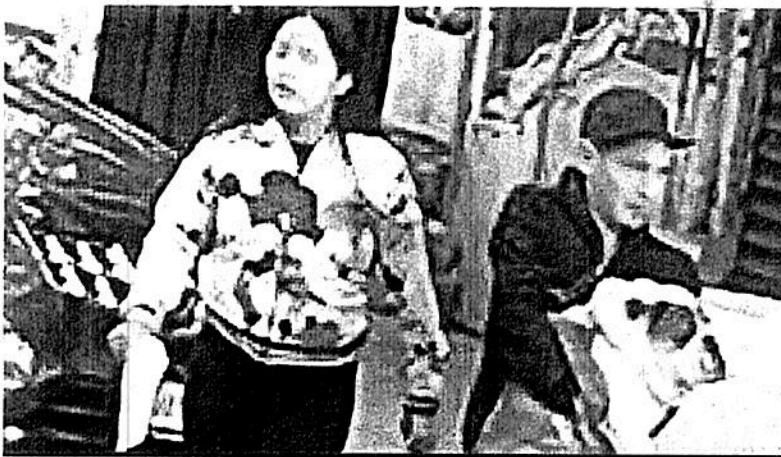
La semana pasada se captó en video el robo de un pitbull en la colonia Roma.

❖ Las colonias donde se ha registrado este delito son la Roma, Juárez y Narvarte, en la Cuauhtémoc; Anzures, en Miguel Hidalgo, y Clavería, en Azcapotzalco ❖ De acuerdo con la Fiscalía General de Justicia capitalina el robo de mascotas está catalogado como delito de bajo impacto