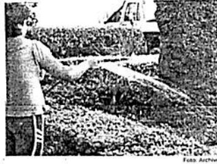
La medida se implementó para evitar que se desperdicie el agua regando jardines en colonias como Polanco (foto).

"Lo que estamos haciendo es, poner un límite para que no tengan la manguera abierta regando los jardines mientras en el Oriente no hay agua, ese es el objetivo. Se puede regar, pero de una manera eficiente. Y como personas de muy alto nivel económico en la ciudad, no se trata de un castigo a ellos sino llamarlos a la cooperación para que usen distintos mecanismos de riego eficiente que no tengan el problema de gasio de