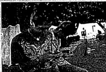
A nivel nacional, los mexicanos usan internet principalmente para entretenimiento, seguido por actividades de comunicación.

Además, dos millones de usuarios utilizan internet para consumir contenidos audiovisuales de pago a OTT, como por ejemplo Netflix, ClaroVideo o iFilm.