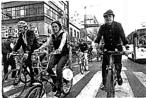
La jefa de gobierno, encabezó la puesta en marcha del Trolebici en Eje Central

Para consolidar el proyecto se invirtieron $59.9 millones de pesos y se efectuó la adecuación de 15.5 kilómetros de Eje Central: de Río Churubusco a Eje 5 Norte