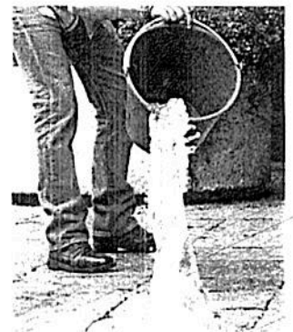
Estas medidas se tomaron para evitar que se tire agua

Las demarcaciones que tendrán un aumento son: Álvaro Obregón, Benito Juárez, Coyoacán, Cuajimalpa, Cuauhtémoc, Magdalena Contreras, Miguel Hidalgo y Tlalpan