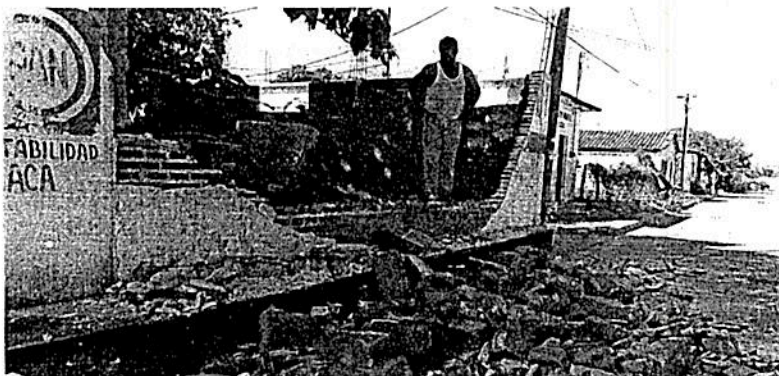
Tras el sismo del jueves pasado, con epicentro en Oaxaca, se reportó la caída de bardas y afectaciones en ocho escuelas. Además, personas fueron atendidas después de sufrir crisis nerviosas.

ROSELIA CHACA EL UNIVERSAL Oaxaca roselia@eluniversal.com.mx