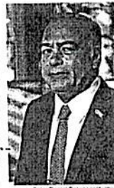
El Gobierno capitalino acusó a Collins de uso ilegal de atribuciones y facultades.

determinara la prescripción de la imputación del delito a un exfuncionario de la administración de Miguel Ángel Mancera, la semana pasada. El próximo lunes un juez federal dará su resolución ante el Juicio de amparo que Collins tramitó el año pasado. La Fiscalía General de Justicia de la CDMX informó que apelará dicha resolución para que se resuelva, conforme a derecho, la controversia que se plantea, basada en criterios emitidos por la Suprema Corte de Justicia de la Nación (SCJN).