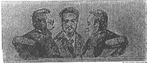
Ilustración: David Bray