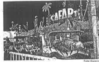
El accidente ocurrió en la Feria San Francisco Pachuca Hidalgo 2019; la menor muerta era hija del operador del juego mecánico.

El juego donde ocurrió el incidente se llama Safari; la menor estaba al cuidado de su padre cuando hubo una descarga eléctrica en la atracción mecánica y ésta alcanzó a la niña. Los primeros reportes indican que el accidente ocurrió el jueves a las 19:00 horas en la Feria San Francisco Pachuca Hidalgo 2019. Tras recibir una llamada de emergencia, los paramédicos de la Cruz Roja llegaron al lugar y trasladaron a la infante a la clínica del ISSSTE de Pachuca.