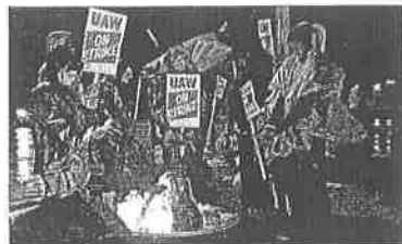
Miembros del sindicato United Auto Workers se mantienen en huelga frente al Centro de la Asamblea General Motors Wentzville, Missouri.

Como consecuencia, los fabricantes ya comenzaron a recibir la menor demanda de componentes. Al respecto, el secretario de Desarrollo Sustentable del go-