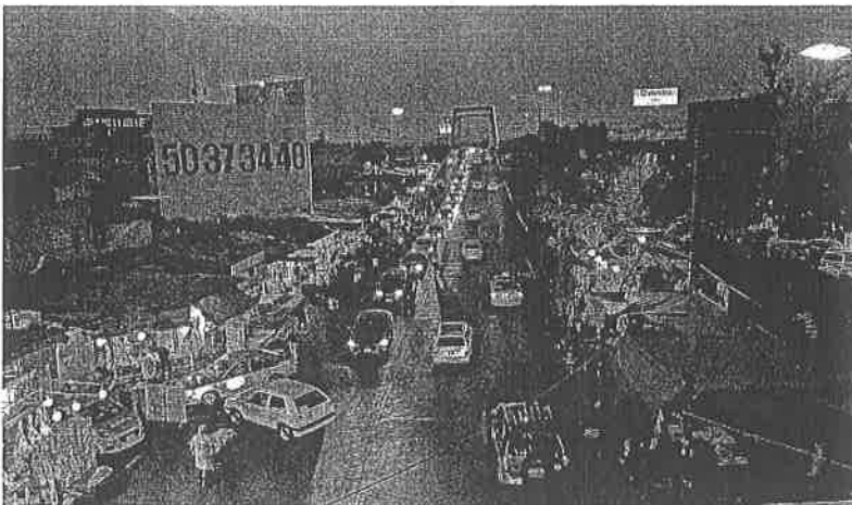
La policía capitalina resguarda Anillo Periférico antes de Calle 7 para evitar que el transporte de carga se estacione e impida el paso a los automóviles.