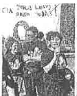
Activistas celebraron la reclassificación del caso.