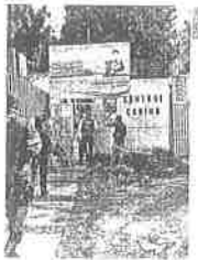
Inspección. Autoridades ambientales del Edomex y del ayuntamiento revisaron el centro canino.