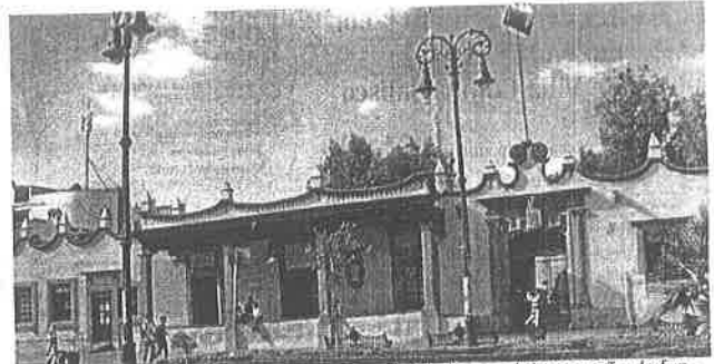
En la alcaldía Coyoacán se detectaron irregularidades en el desempeño de funcionarios que fueron separados de su cargo

Se informó que la autoridad determinó llevar a cabo esta suspensión mientras se realizan las investigaciones necesarias, para establecer la presunta responsabilidad de los servidores públicos mencionados.