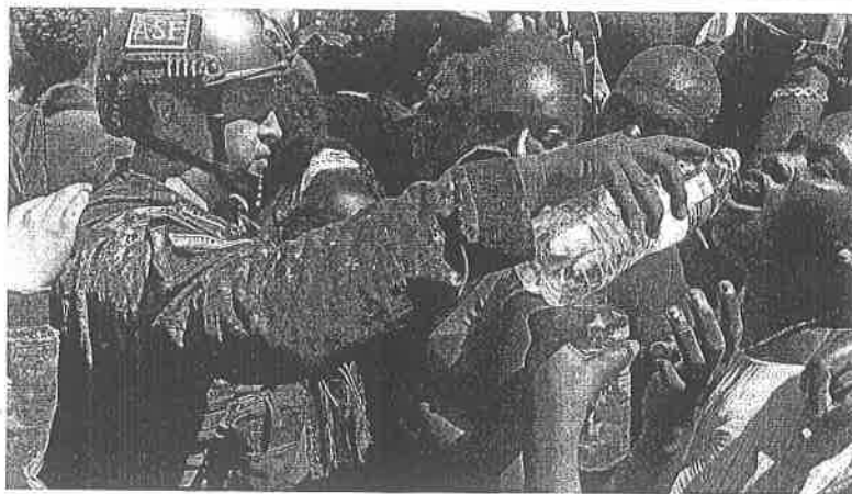
Elementos federales dieron agua a mujeres embarazadas y a niños deshidratados por los rayos del sol, que provocó temperaturas de hasta 48 grados.

Facebook es la red social con el mayor número de usuarios en México, pues 99% la utiliza, seguida de WhatsApp, con 93%, la cual también pertenece al consorcio que encabeza Mark Zuckerberg, de acuerdo con cifras de Statista a 2019. ●