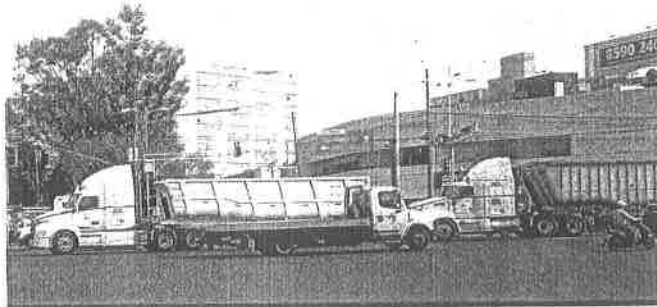
Ciclistas arriesgan su vida al transitar diariamente por la avenida Cuitláhuac en Azcapotzalco.

situación tomaron las calles, exigiendo justicia por la mujer.