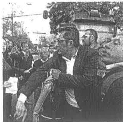
Hay conductores que se molestan con quienes bloquean las vialidades

El espíritu de este nuevo protocolo es garantizar el ejercicio de los derechos de todas las personas, tanto los derechos a la