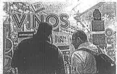
El Buen Fin es una excelente oportunidad para echar a andar la creatividad y destacar entre el mar de ofertas, dice la red social.

CARLA MARTÍNEZ —cartera@eluniversal.com.mx