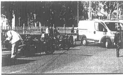
Servicios periciales llegaron a la calle Rabaúl y Prolongación Nueces, para realizar las investigaciones donde fue atropellada una mujer el pasado jueves.

En el rubro para mejorar la movilidad, Llerenas Morales explicó que se proyecta la construcción de cuatro ciclovías, la primera en la avenida Camarones desde el Casco de Santo Tomás a la estación del Metro Camarones, otra más en la avenida Azcapotzalco desde la calle de Ferrocarriles Nacionales a la avenida Camarones, una tercera en la continuación de la calle Ferrocarriles Nacionales en donde también se intervendrá con la rehabilitación de banquetas, cruces peatonales, sustitución de luminarias y mobiliario urbano, y finalmente otra ciclovía en la calle 22 de febrero desde Camarones hasta la calle Antigua Calzada de Guadalupe.