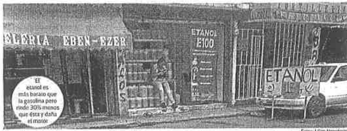
El etanol es más barato que la gasolina pero que ésta y daña al motor.