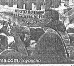
Videos en posesión de REFORMA documentaron cómo el 25 de julio servidores afiliaron al PRD a cambio de apoyos.