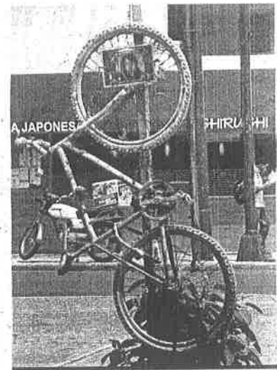
Cuando un ciclista muere atropellado, asociaciones civiles colocan una bicicleta pintada de blanco en memoria de las víctimas.

Dijo que el lugar donde gobierna requiere una gran inversión para el mejoramiento urbano, ya que