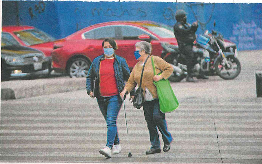
Miles de personas en su mayoría mujeres y niños se dedican por tiempo completo a los cuidados de familiares, y se ven obligados a dejar estudios, empleo y desarrollo personal