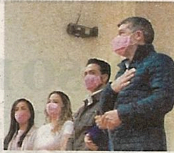
Mauricio Tabe, alcalde de MH.

Y es que como resultado de esta unión, 300 vecinas de esta demarcación se verán beneficiadas al poder realizarse mastografías de manera gratuita, esto con la intención de detectar cualquier indicio de cáncer de mama. • (Redacción)