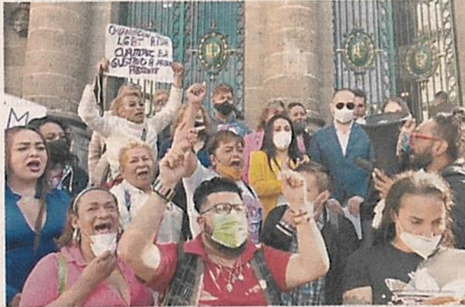
Decenas de manifestantes acudieron ayer al Congreso capitalino para pedir la restitución del programa.

Aseguró que el programa destacaba por tratarse de