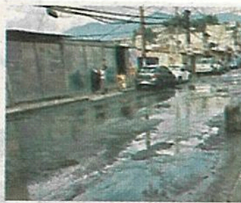
Falta de mantenimiento

En su denuncia, la habitante de esta colonia, demandó que las