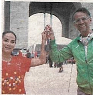
El Maratón es una fiesta de la CDMX

“Necesitamos una sanación física y espiritual y el Maratón va a ayudar mucho a eso, necesitamos salir a las calles...ahora estamos en otra etapa, con una gran vacunación que está por convertirse en una vacunación universal, mañana (hoy) estamos en Semáforo Verde y eso va hacer un cambio importante en el estado de ánimo de la gente”, enfatizó el secretario de Gobierno.