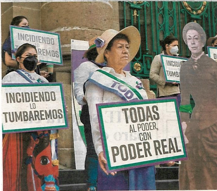
Feministas se manifestaron ayer frente al Congreso de la Ciudad de México

A 68 años de que las mujeres mexicanas acudieron por primera vez a las urnas a ejercer su voto, feministas de todo el país presentaron la agrupación política Todas México. Entre sus objetivos iniciales están organizar y articular a las distintas asociaciones e impulsar a nivel federal, estatal y municipal políticas contra la violencia y la pobreza que afectan a este sector de la población. Pág. 9