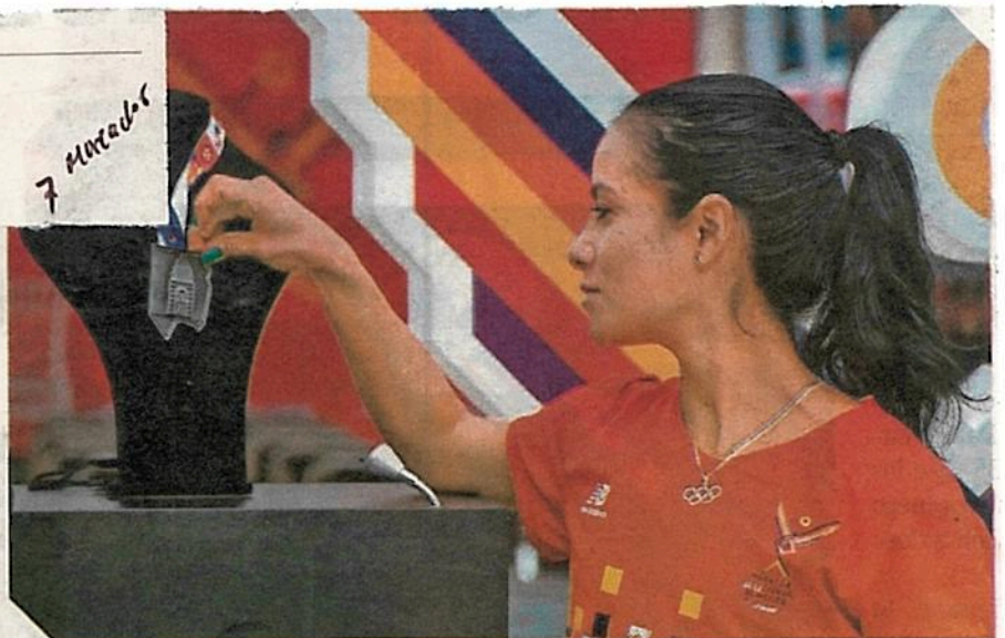
Este domingo presentaron la playera y la medalla que se usarán en la edición XXXVIII del Maratón de la Ciudad de México.

El funcionario expuso que hay que seguir usando el cubrebocas y seguirse cuidando durante un lapso largo todavía pues