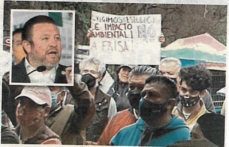
Los vecinos reclaman al alcalde

de julio, fecha en que algunos líderes firmaron un acuerdo de colaboración