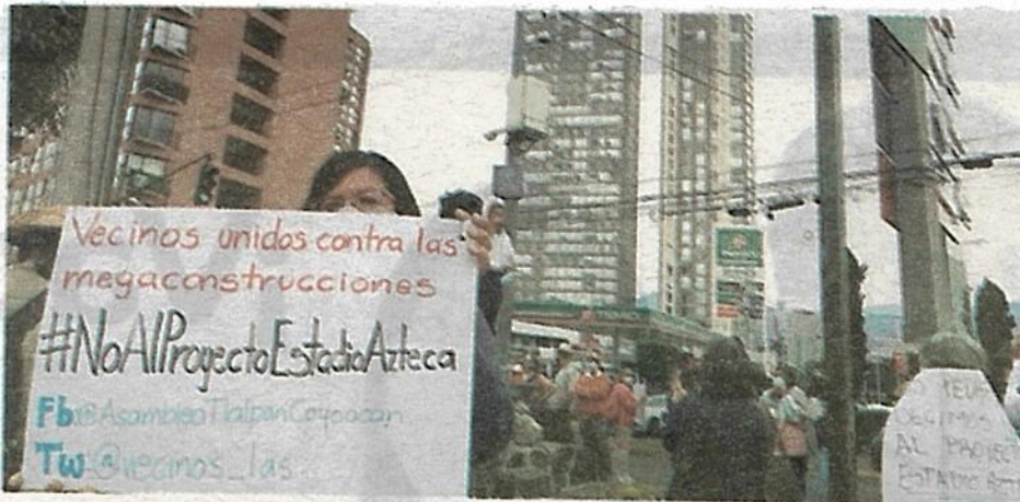
Aseguran que se elevará el precio de los servicios