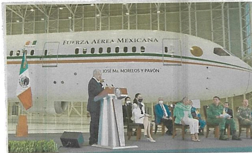
El presidente Andrés Manuel López Obrador ofreció ayer su conferencia de prensa en el antiguo Hangar Presidencial, con el avión de fondo.

Al final de la conferencia de prensa, el Presidente pidió a algunos integrantes de su gabinete tomarse una foto para que la población compare el tamaño del avión, mientras él se retiró del aeropuerto. ●