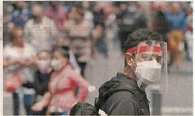
■ En diversas zonas, también se utiliza la careta para prevenir los contagios de coronavirus.

“Será obligatorio para todas las personas que habiten o transiten en la Ciudad de México el uso de cubrebocas; la práctica de la etiqueta respiratoria: cubrirse la nariz y boca al toser o estornudar, con un pañuelo desechable