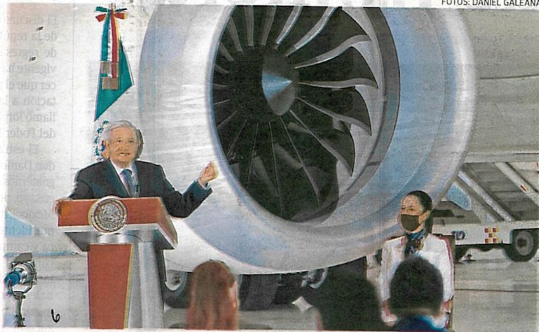
El mandatario dijo que el avión es "tan grande, tan grande que las personas se ven pequeñas"