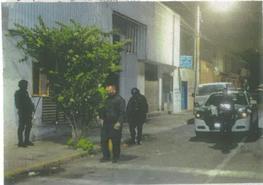
El viernes en la noche se realizaron cateos en domicilios de la Gustavo A. Madero

Con Información de Cecilia Nava; Arturo Pansza, Jaime Llera y Alberto Jiménez, La Prensa; e Elizabeth Ibal, El Occidental