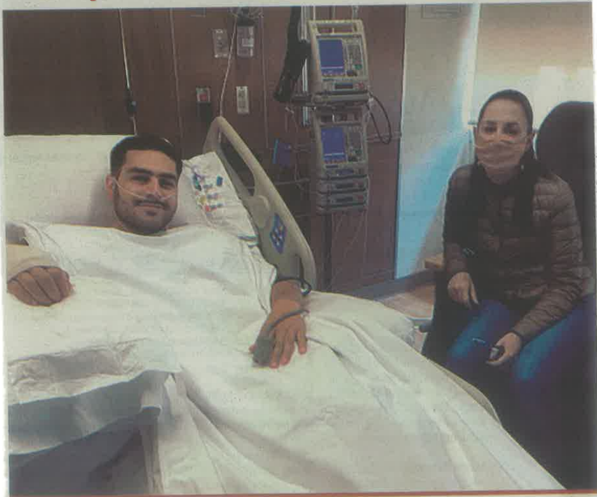
Claudia Sheinbaum divulgó esta foto en su cuenta de Twitter de su visita a Omar García Harfuch en el hospital.

La investigación en las primeras horas lleva al aseguramiento de personas participantes, cocaína y "más indicios" sobre el origen del ataque al jefe policial Omar García Harfuch