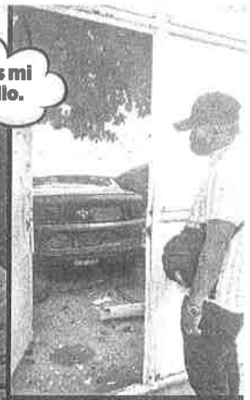
También incautaron "carrazos" en bodega ligada a la agresión.