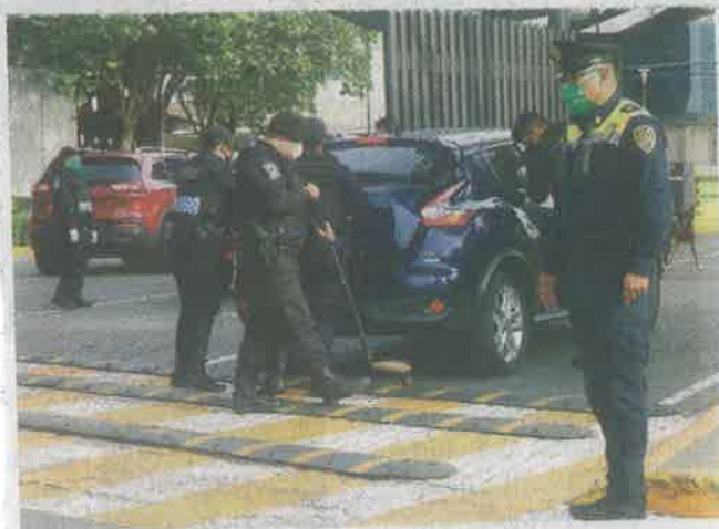
Las extensas revisiones incluyen un registro por dentro y por la parte de abajo de los vehículos que ingresan al hospital