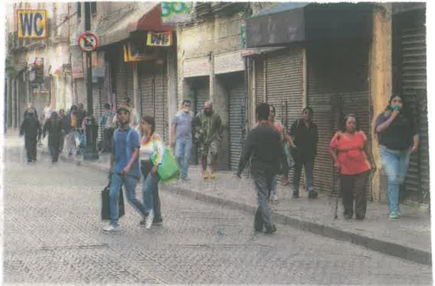
Cerca de 27 mil comercios establecidos operan en el Centro Histórico, lo que lo convierte en el mayor centro económico de la ciudad

Una vez que la ciudad pasó del color rojo al naranja en el semáforo epidemiológico estos son los negocios que abrirán sus puertas: comercio al menudeo (excepto aquellos que se encuentren ubicados en Plazas, Centros Comerciales y Tiendas