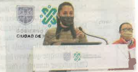
La jefa de gobierno de la CDMX, Claudia Sheinbaum Pardo, refrendó: "tenemos una gran policía"

Se comprometió a darle todo el apoyo a los familiares de una mujer que murió en el lugar del ataque, así como a las dos personas que formaban parte de la SSC, al tiempo que insistió en decir que está muy orgullosa de la actuación de la policía de la Ciudad de México y que "vamos a seguir trabajando como hasta ahora".