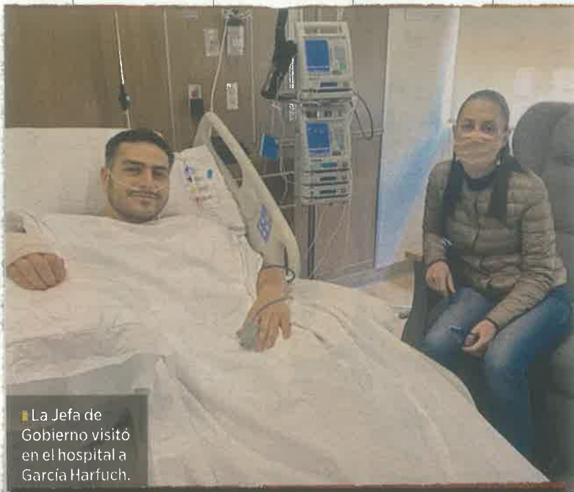
La Jefa de Gobierno visitó en el hospital a García Harfuch.

“Nuestro Secretario está bien y con más energía que nunca, tenemos una gran policía encabezada por un líder, honesto preparado y valiente”.