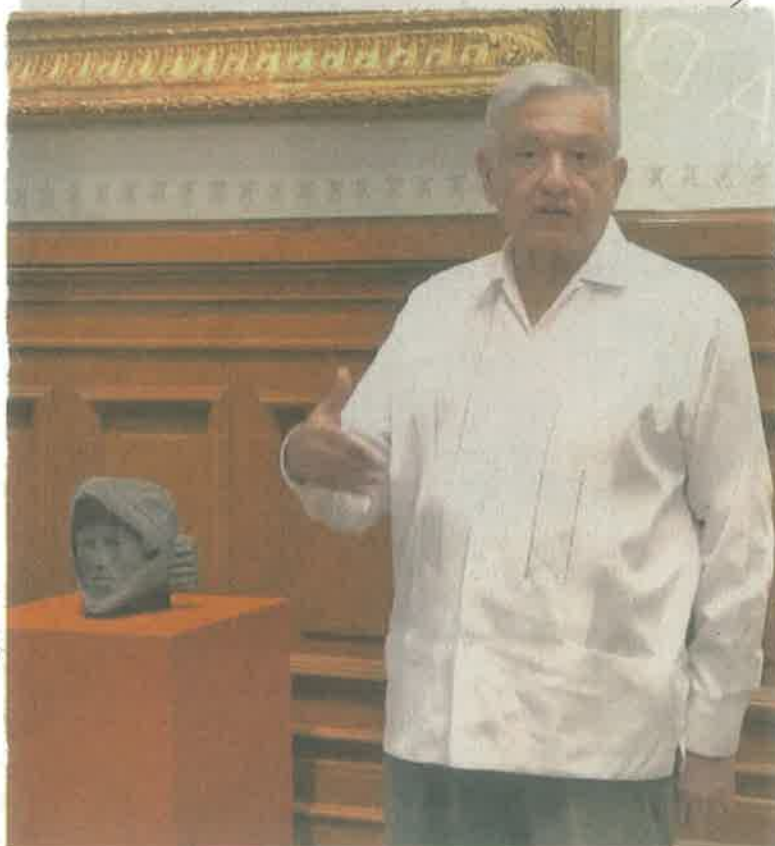
En un videomensaje, el mandatario federal, Andrés Manuel López Obrador, dijo que su administración actuará para evitar que se cometan atentados.