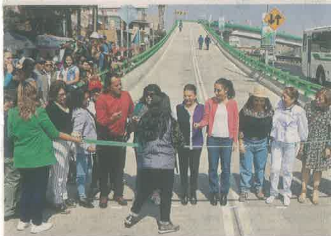
La construcción del puente requirió de 50 millones de pesos y 300 trabajadores, 40 mujeres de la región.

"Han pasado muchos gobiernos y la lucha de la gente siempre fue un puente que garantizara que la población pudiera salir dignamente a su trabajo", expuso la Alcaldesa de Iztapalapa, Clara Brugada, quien también acudió a la inauguración del puente.