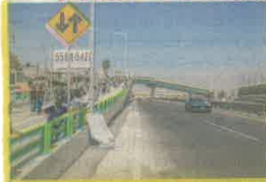
GERMÁN ESPINDOSA, EL GRÁFICO