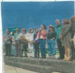
7 Inaugura CDMX puente vehicular en Iztapalapa; costó 50 mdp