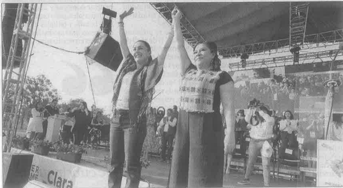
▲ La mandataria y la alcaldesa, al terminar ésta su primer informe de gobierno.

Acompañada por representantes del gobierno federal y del Poder Judicial local y legisladores, advirtió que no se tolerarán más actos de corrupción.