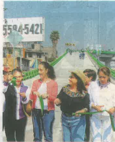
La mandataria anunció más unidades RTP en la zona

"Realmente es un puente de vínculo entre el Estado de México, Los Reyes La Paz e Iztapalapa. Le vamos a llamar el puente Emiliano Zapata y es algo fundamental para la ciudad, el reconocimiento de todas estas zonas periféricas como parte de los habitantes de la ciudad que deben tener los mismos derechos que los que viven en el centro", puntualizó.