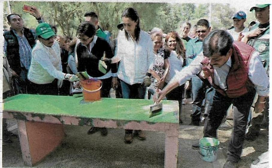
En el Bosque de Aragón, la mandataria también informó que destinarán 50 millones de pesos para su rehabilitación

Dicha determinación deja sin efecto la orden de aprehensión girada en contra de