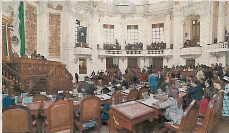
Entre los pendientes en el Congreso local también está la lista pública de agresores sexuales y modificaciones a la ley de protección civil.

Sheinbaum: no interferiré en elección. El viernes, Sheinbaum Pardo se reunió con los legisladores, quienes también comentaron el tema del coordinador, aunque la