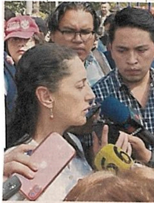
■ La Jefa de Gobierno aseguró que confía en la FGJ.

“Yo confío en que en todos estos casos va a haber justicia”, subrayó la Jefa de Gobierno.