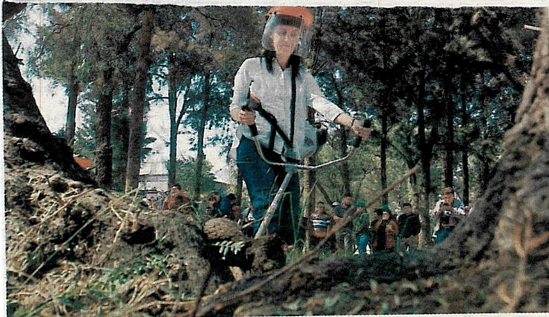
La mandataria capitalina ayer durante el Sábado de Tequio en GAM.

Claudia Sheinbaum. La jefa de Gobierno dijo que confía en la Fiscalía de CdMx; invertirán más de 100 mdp en zoológicos