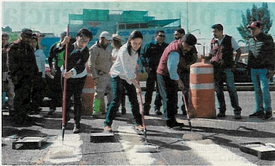
Claudia Sheinbaum participó en la jornada de Sábado de Tequio en avenida 541, San Juan de Aragón, Segunda Sección, en Gustavo A. Madero.