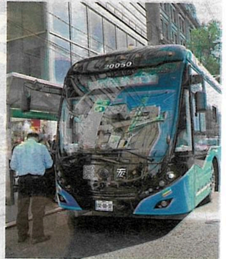
Revivien a los trolebuses en la ciudad

Si el concurso transcurre como lo planeado, será en un mes cuando se conozca a los ganadores para construir el proyecto