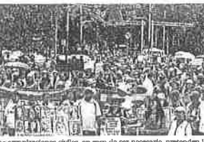
Las organizaciones civiles, en caso de ser necesario, pretenden llevar el caso de la declaratoria de la alerta hasta la Suprema Corte de Justicia de la Nación.