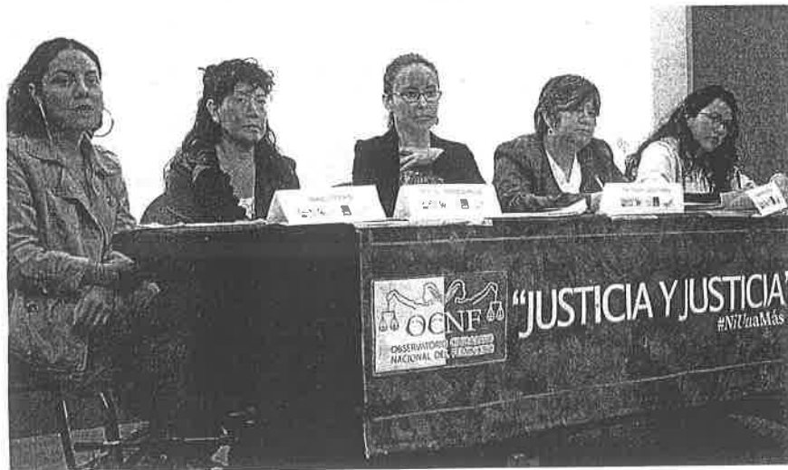
Las solicitantes exigieron a la Conavim decretar la alerta tras la orden judicial

El mecanismo no ha servido porque las autoridades no quieren hacer una investigación de fondo, no hay plan de seguimiento a las alertas”