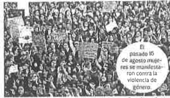
El pasado 16 de agosto mujeres se manifestaron contra la violencia de género.

"La autoridad responsable debe declarar la Alerta de Violencia de Género contra las Mujeres solicitada, tomando en cuenta que es un mecanismo de emergencia, por tanto, las acciones que se implementen no deben confundirse con las políticas públicas u otros instrumentos