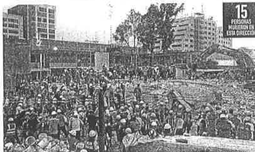
15 PERSONAS MURIERON EN ESTA DIRECCIÓN