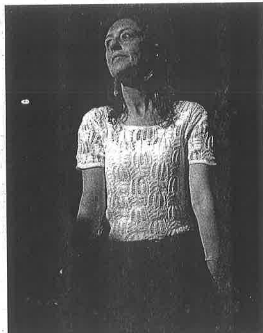
La mandataria acude hoy al Congreso local. JESÚS QUINTANAR

El documento se divide en seis ejes: Igualdad de derechos; Ciudad