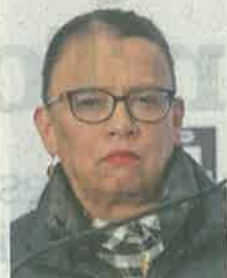
Rosa Icela Rodríguez