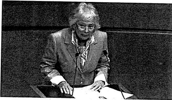
Olga Sánchez Cordero

Ahora que se dieron los primeros cambios en el gabinete de la jefa de Gobierno, Claudia Sheinbaum , nos recuerdan que el archivo de notarías de la Ciudad de México está en riesgo. Uno de los méritos de la administración capitalina pasada, afirman varios notarios, fue la optimización del Registro Público de la Propiedad. Durante décadas, los usuarios del servicio padecieron rechazos, mutilaciones en sus documentos, demoras y cobros injustificados derivados de la corrupción. El sexenio pasado se contrató personal que logró depurar los vicios, sin embargo, el cambio de gobierno, señalan los afectados, trajo consigo el retorno de las ineficiencias y reparaciones que no se han hecho desde el terremoto del 19 de septiembre de 2017. Así como con la seguridad, nos señalan, hay otros rubros que requieren un ajuste de tuercas.