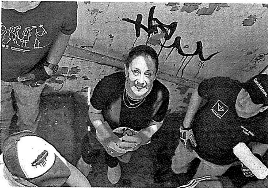
La jefa de Gobierno capitalina. OCTAVIO HOYOS

Sheinbaum tiene mucho para ser buena gobernante, pero requiere de respeto del Presidente; lo ocurrido la muestra más y aumenta el sentimiento de indignación por lo que ocurre en CdMx, y no fortalece a quien se hace cargo de una de las ciudades más complejas y demandantes del mundo