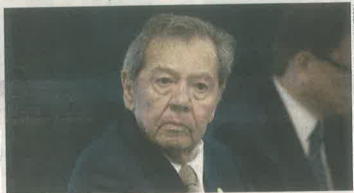
Porfirio Muñoz Ledo

do de negocios. La necesidad llevó a un pronto nombramiento que ahora debe ser ratificado fast track en el Senado.