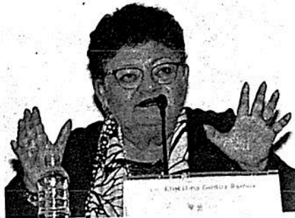
LA PROCURADORA Ernestina Godoy informó sobre cambios en la estructura de la dependencia

"El día de mañana dejo la Jefatura de la Policía de Investigación (...) precisamente para ayudar a sentar las bases de una POLICIA sólida, algo que en la PDI iniciamos