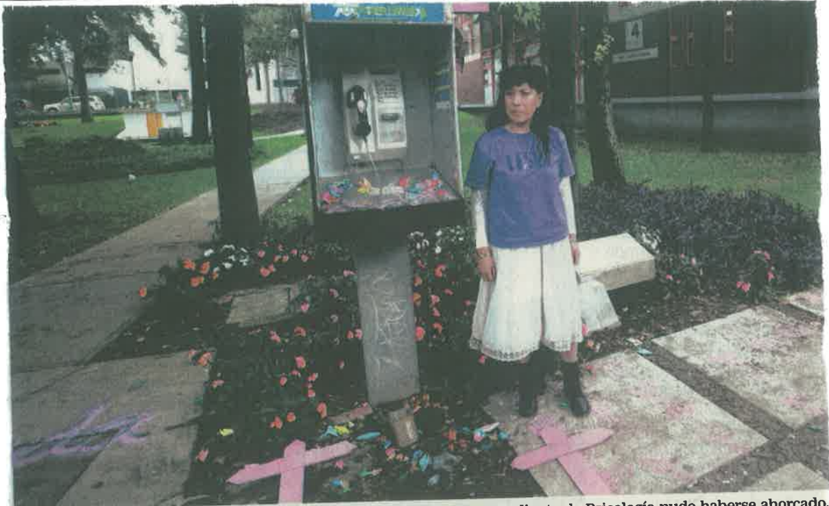
En el juicio se presentó un peritaje que derribó la teoría de que la estudiante de Psicología pudo haberse ahorcado.