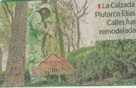
La Calzada Plutarco Elías Calles fue remodelada.