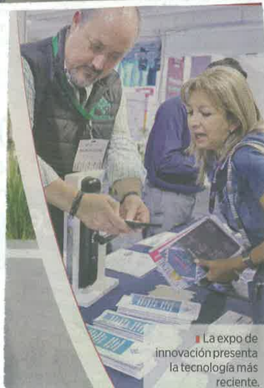
La expo de innovación presenta la tecnología más reciente.