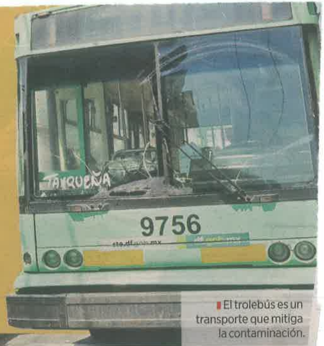
El trolebús es un transporte que mitiga la contaminación.