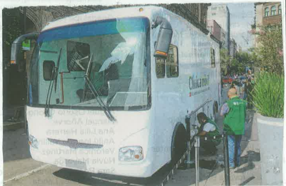
El llamado Medibús fue donado por la Agencia de Cooperación y Coordinación Turca

El consultorio de Rayos X tiene una grúa médica para facilitar la atención de personas con movilidad limitada, equipo de Rayos X portátil, aire acondicionado, vitrinas para almacenamiento de medicamento y materiales de curación.