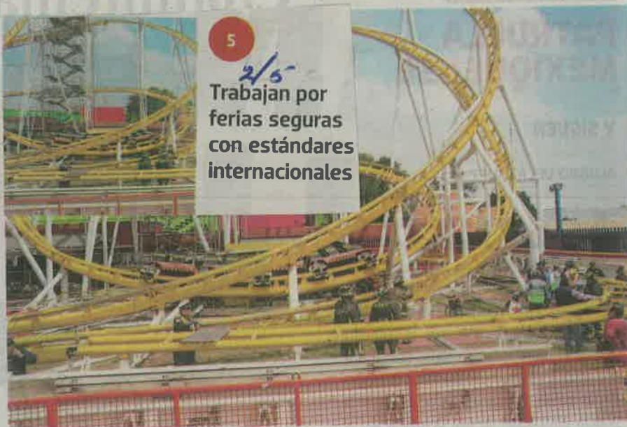
El pasado 28 de septiembre se registró un accidente en la Feria de Chapultepec, al descarrilarse "La Quimera", donde fallecieron dos personas

Dijo que la coordinación entre todos los sectores es primordial para garantizar