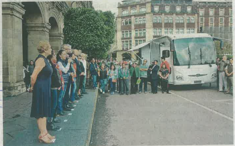
La jefa de gobierno encabezó el acto afuera de Palacio de Gobierno

Durante la ceremonia en la que estuvo el embajador de Turquía en México, Tahsin Timur Söylemez, la responsable de la administración de la metrópoli sostuvo que la unidad médica móvil realizará recorridos, con el objetivo de atender principalmente a cerca de 4 mil 500 personas en situación de calle y que por diversas