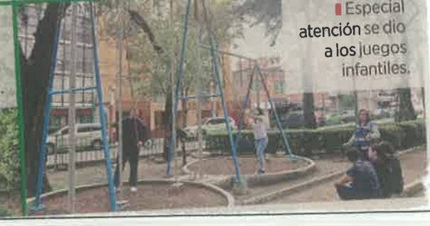
Especial atención se dio a los juegos infantiles.