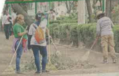
Colonos se sumaron al Tequio.