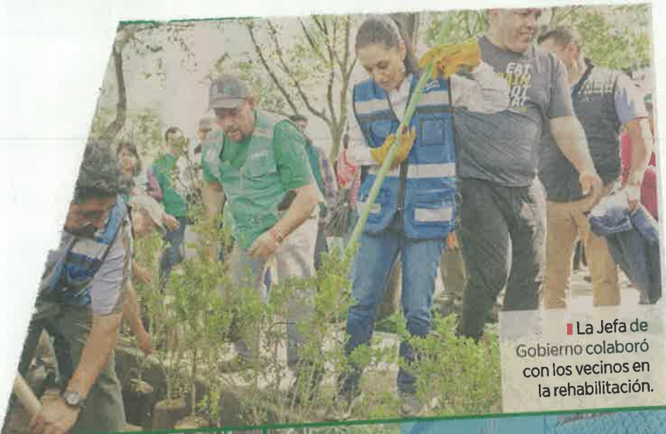
La Jefa de Gobierno colaboró con los vecinos en la rehabilitación.

El Sábado de Tequio es una jornada comunitaria enfocada en el mejoramiento urbano de cada un barrio, colonia o pueblo de la Ciudad, en donde participan de manera conjunta servidores de la Ciudad de México y vecinos.