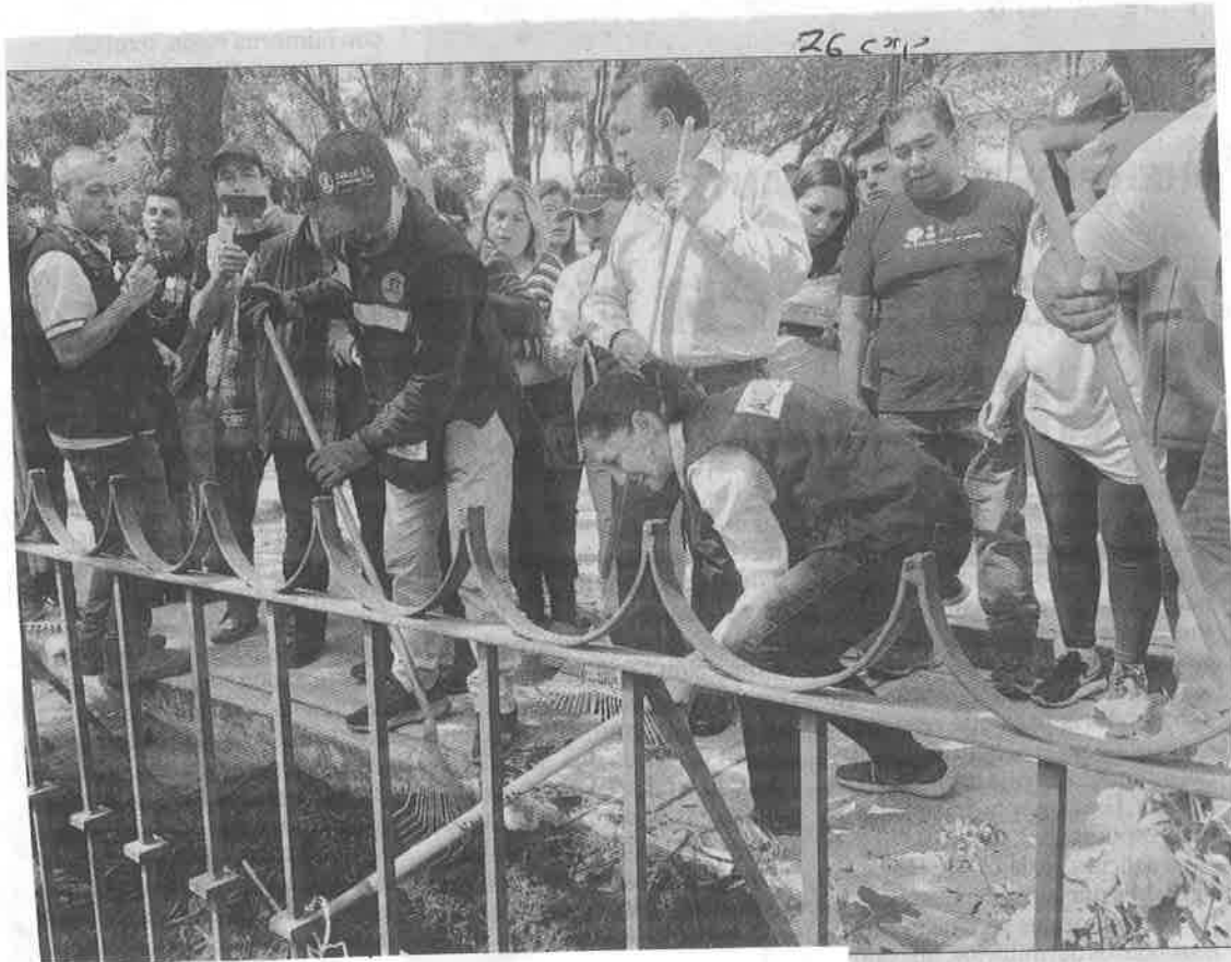
▲ La jefa de Gobierno con el alcalde de Iztacalco durante el Sábado de tequio en la avenida Plutarco Elfas Calles.