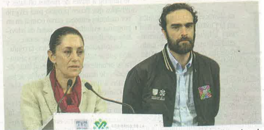
La jefa de gobierno, Claudia Sheinbaum, al darse a conocer los detalles sobre el proyecto de trolebús elevado