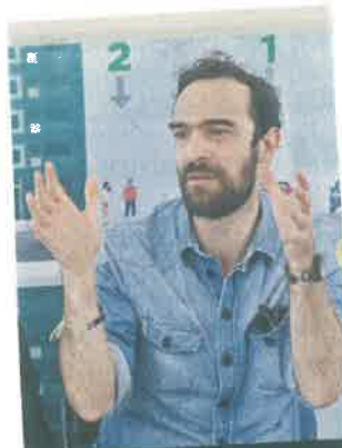
Andrés Lajous, titular de Semovi

La semana pasada rompió récord la Línea 1 del Metrobús y eso es porque ya tenemos otros biarticulados, estamos casi arriba de 600 mil pasajeros al día".