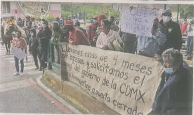
■ Más de cuatro meses tienen en angustia unas 15 mil personas que dependen de las carreras de caballos.