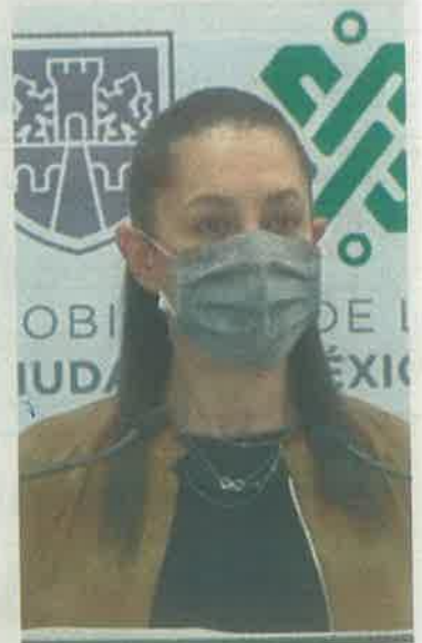
Estables, tres semanas

Sheinbaum agregó que al momento de practicarse la prueba, el paciente deberá proporcionar sus datos, mismos que proporcionará al momento de consultar en su teléfono móvil los resultados de la prueba.