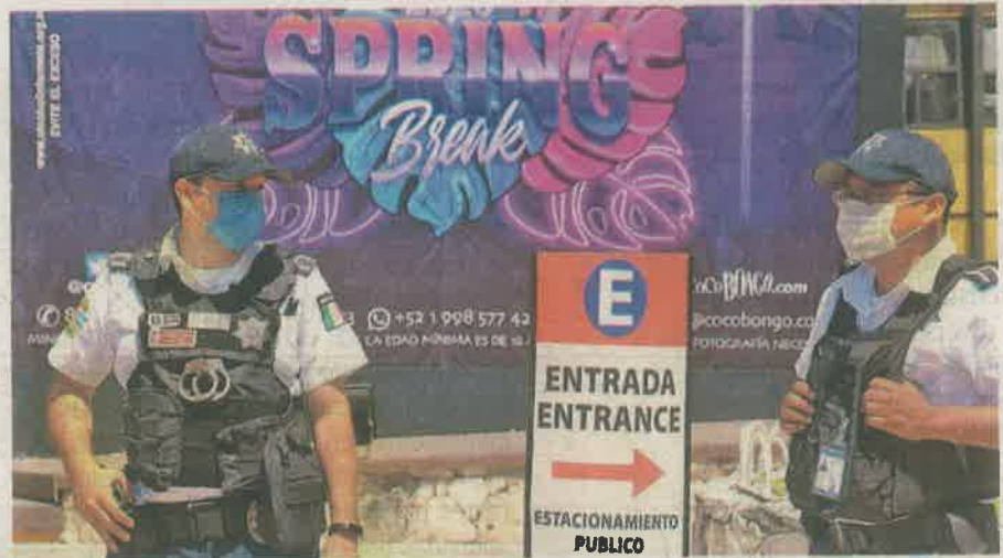
Las principales discotecas y antros de esta ciudad, a partir del día de hoy, se encuentran cerradas

De acuerdo con datos de la Cámara de Comercio en Pequeño de la Ciudad de México (Canacope CDMX), alrededor del 20% de los negocios de este giro están en peligro de cerrar sus puertas de forma definitiva, tras casi seis meses sin operación. Indica que cerca del 70% de los comercios de entretenimiento pueden cerrar definitivamente a final de año si las condiciones no mejoran.