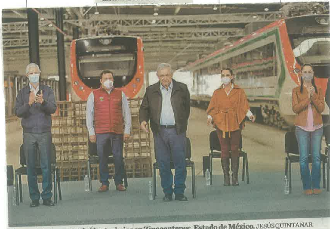
El mandatario supervisó los trabajos en Zinacantepec, Estado de México.