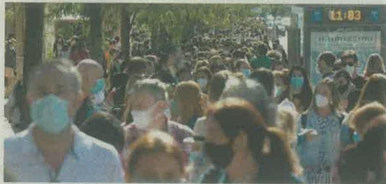
Serán 360 personas contagiadas, de cuatro alcaldías

Mesilato de Camostat y Artemisa Anua, son los medica-