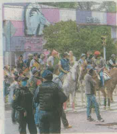
Bloquean jinetes del Hipódromo de las Américas la lateral de Periférico

"Nosotros somos los más afectados, los policías y la demás gente reciben su pago cada quincena sin problema, pero nosotros si no corremos no comemos. Ya llevamos varios meses sin poder trabajar", comentó un jinete. Durante varias horas, los trabajadores se colocaron en los tres carriles la-