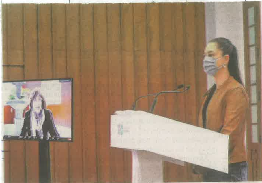
La jefa de gobierno de la CDMX, Claudia Sheinbaum, exhorta a la población a conmemorar las fechas patrias desde casa, porque los contagios permanecen

El Mesilato de Camostat se ha probado en pacientes con pancreatitis y esofagitis , en tanto que Artemisia Annuu contiene agentes que han mostrado que tienen actividad antiviral contra el Covid-19