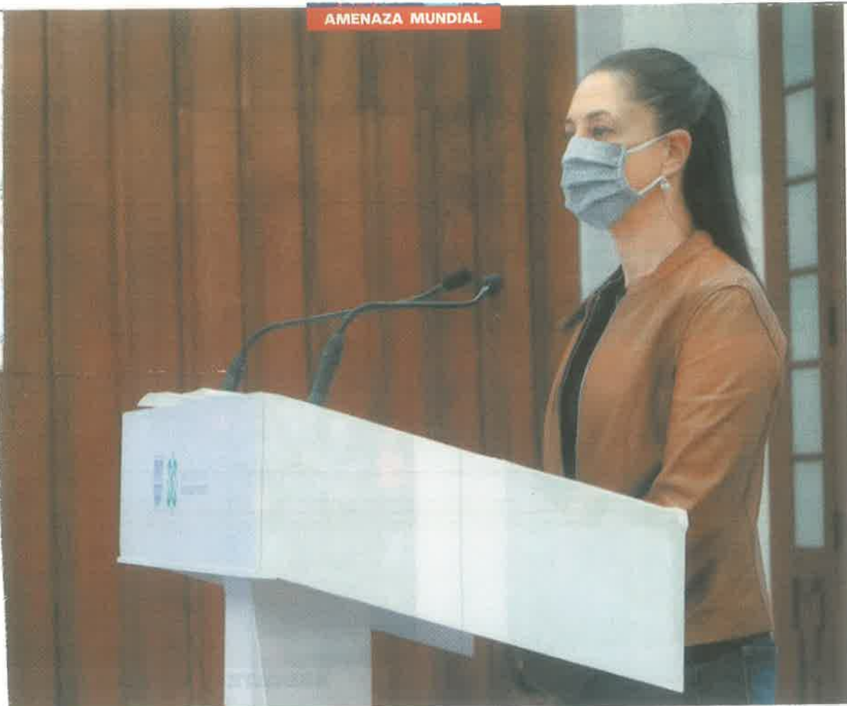
ESTABLE | • La jefa de Gobierno, Claudia Sheinbaum, anunció que la ciudad se mantiene en semáforo naranja.