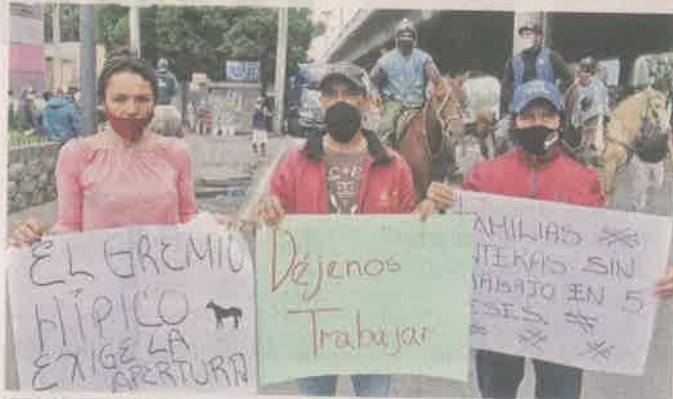
AL LÍMITE. Con todo listo para las carreras, éstas se cancelaron de última hora.