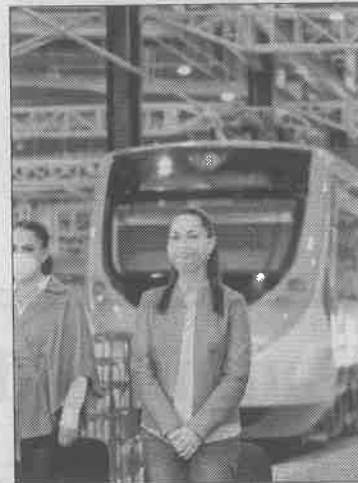
▲ La jefa de Gobierno acompañó al presidente López Obrador y a Alfredo del Mazo, mandatario mexiquense, a un recorrido por las obras del Tren Interurbano. México-Toluca.

Como resultado de la intervención se han realizado 224 mil 55 visitas informativas casa por casa, se entregaron 2 mil 338 apoyos y se ha ayudado a 362 comerciantes de venta de alimentos en vía pública.