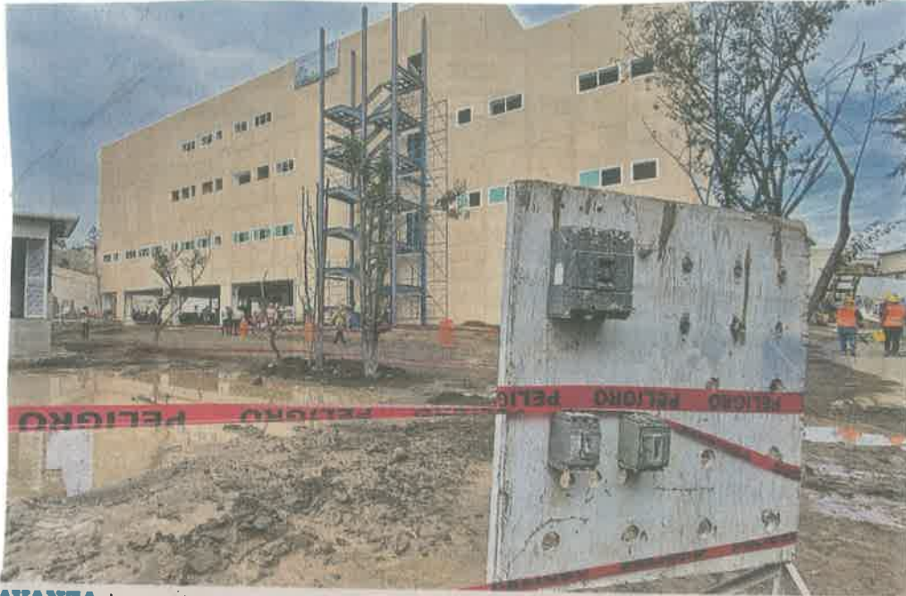
AVANZA. La construcción en San Miguel Topilejo va al 81 por ciento tras 7 meses de labores.