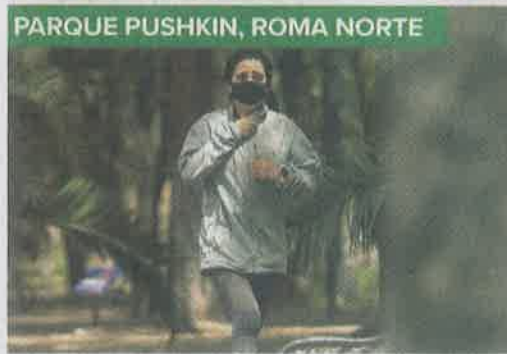
PARQUE PUSHKIN, ROMA NORTE