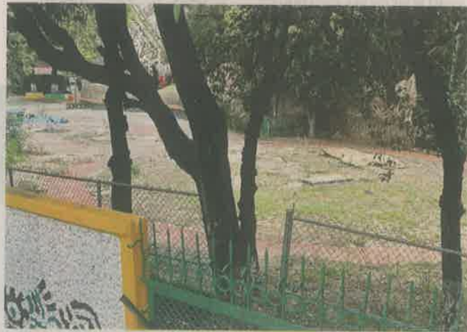
Las instalaciones estuvieron abandonadas durante la licitación.

ral de Justicia aseguró el inmueble hasta el 14 de abril de 2020 para realizar las investigaciones por la muerte de dos jóvenes en un juego mecánico y después sobrevino la emergencia sanitaria, reportó la Secretaría de Medio Ambiente.