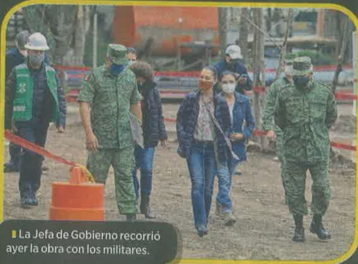
La Jefa de Gobierno recorrió ayer la obra con los militares.