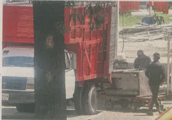
El anterior operador inició el retiro de estructuras de juegos.

Sin embargo, el calendario fue reprogramado, debido a que la Fiscalía Gene-