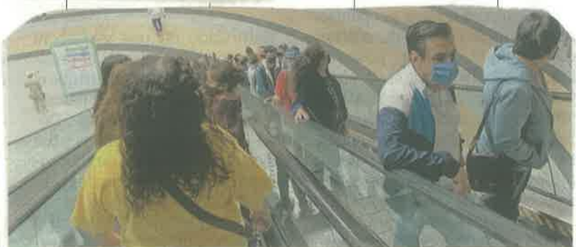
La reapertura se decidió poniendo la salud como prioridad siempre; se debía buscar un balance para no perder más empleos, indicó Claudia Sheinbaum.

“Al principio había retrasos mayores en los resultados, pero cada vez hay menos. El objetivo es que se tome la prueba y que pronto tengan el resultado. Tenemos un promedio