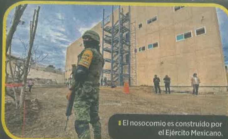
El nosocomio es construido por el Ejército Mexicano.