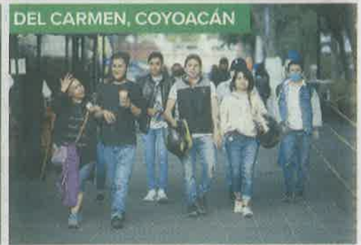
DEL CARMEN, COYOACÁN