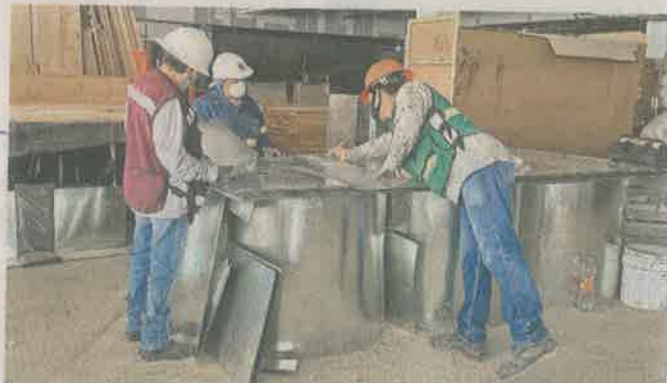
El proyecto a cargo de la Secretaría de la Defensa Nacional generó mil 100 empleos directos y 600 indirectos.

Actualmente, la Ciudad de México tiene 11 hospitales generales y con la construcción de otro en Topilejo, con 81 por ciento de avance, por iniciar, se sumarán 13, destacó la Jefa de Gobierno, Claudia Sheinbaum.