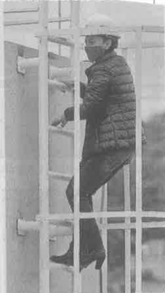
■ La Jefa de Gobierno supervisó la obra ayer.

“Se transita de un Hospital Materno Infantil pequeño, con poca capacidad resolutoria, además que en los últimos años había tenido un proceso de envejecimiento de su planta y de sus equipamientos a un hospital moderno, a un hospital con