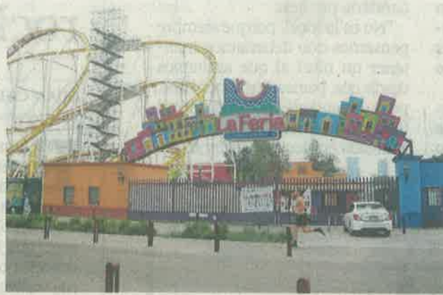
Tras el accidente en la Feria de Chapultepec, la empresa que era responsable del parque inició el retiro de los juegos.

Detalló que el motivo del atraso fue la pandemia y que