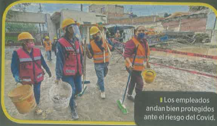
Los empleados andan bien protegidos ante el riesgo del Covid.