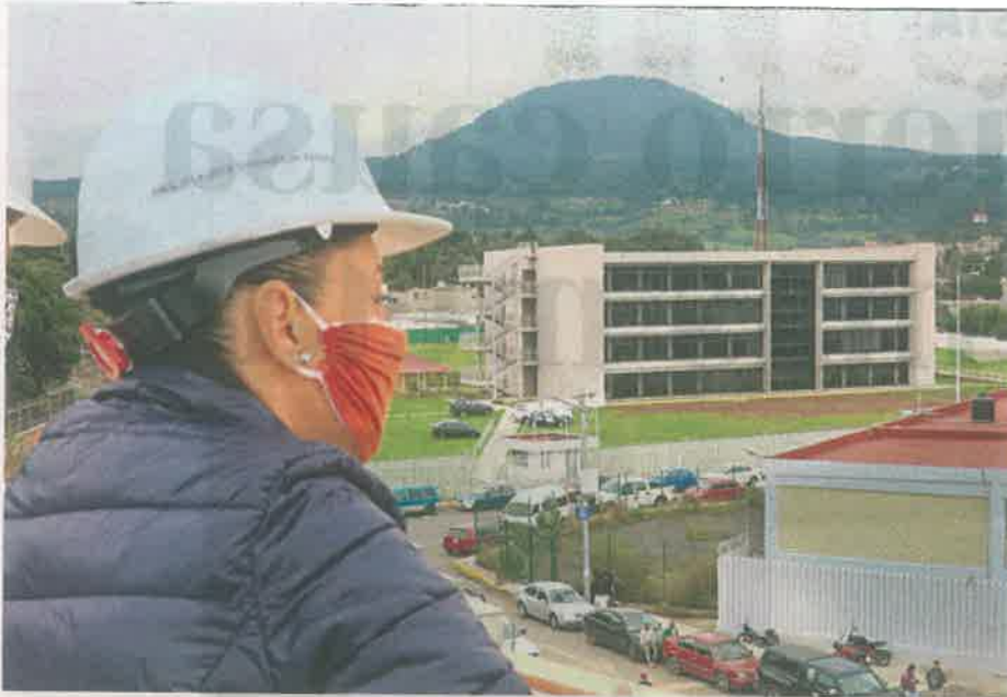
Además de atender a la población de Tlalpan, este hospital recibirá a pobladores de Xochimilco