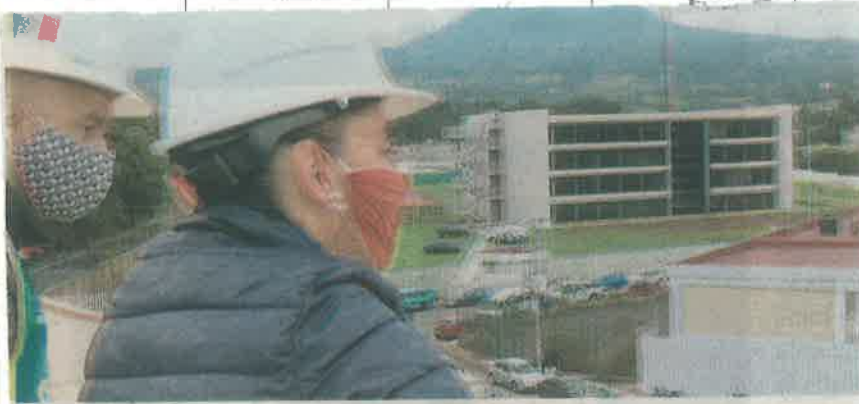
Claudia Sheinbaum y la secretaria de Salud, Oliva López , durante recorrido de supervisión de obras del Hospital General Topilejo, en Tlalpan

MIL PERSONAS con diabetes o hipertensión son atendidas por los centros de salud de la capital del país, lo que implica que por el Covid-19, no dejan de atenderse otras prioridades en el rubro de salubridad