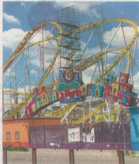
La Montaña Rusa quedará en pie, porque pertenece al gobierno

Para el 13, 14 y 15 de julio las empresas Cabi Entretenimiento S.A.P.I de C.V.; So-