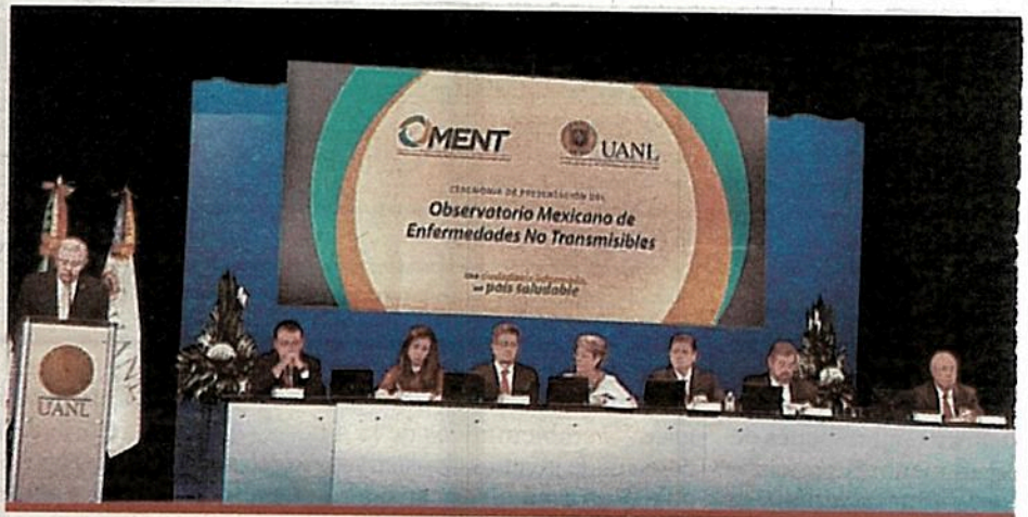
25 de agosto de 2015, día del lanzamiento público del OMENT, con dos años de retraso.

Crónica obtuvo copia del contrato adjudicado sin licitación (SSPDF-CRMSG-SERV-175-18), en el cual se detalla la presta-