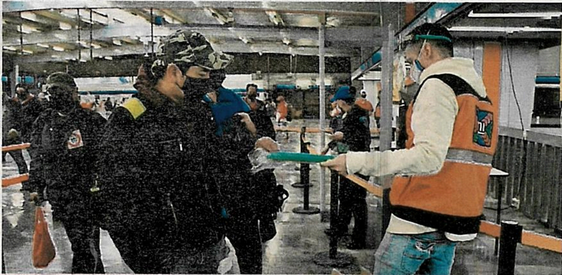
Como lo anunció la titular del Sistema de Transporte Colectivo Metro, Florencia Serranía, ayer en la mañana comenzó el reparto de caretas protectoras para evitar contagios ante aumento de usuarios por la reactivación de actividades.

ranja esta semana —y dejó atrás el rojo— no es momento de “bajar la guardia” ante la crisis sanitaria por la pandemia de coronavirus.