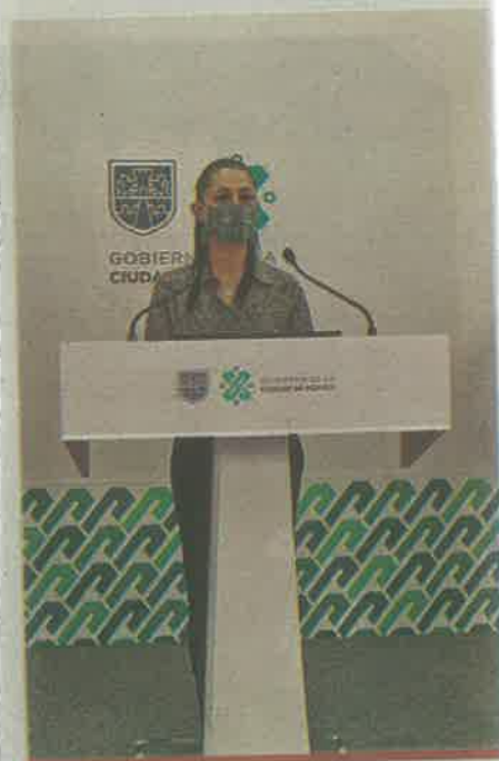
Claudia Sheinbaum, jefa de Gobierno capitalino.

pación (si tienen áreas al aire libre) como lo establece el Semáforo Naranja.