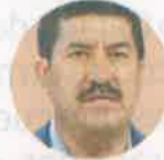
Javier Corral Gobernador de Chihuahua

"LAS Y LOS MEXICANOS tienen derecho a una vida digna, pero, con esta estrategia fallida y sus omisiones, ese derecho está siendo vulnerado. Por eso convocamos a rectificar, porque México lo necesita"