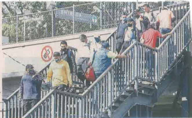
Las autoridades llamaron a no bajar la guardia para mantener la tendencia decreciente en los indicadores sanitarios.

Aun cuando en los últimos 15 días hay un incremento en el número de ca-