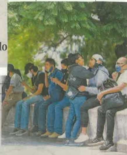
Cada vez hay más gente en la vía pública

Aseguró que en los últimos días ha habido una disminución en el número de personas hospitalizadas por el virus y una