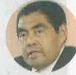
Miguel Barbosa Mandatario de Puebla

"SE REQUIERE una unidad y que no se politice el tema, ya que es necesario mantener el balance en la situación económica y el control de la salud"