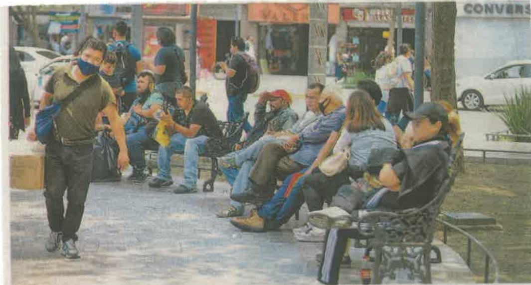
Las autoridades capitalinas no descartan regresar al semáforo rojo si la población relaja las medidas sanitarias ante la pandemia de Covid-19