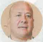
Enrique Alfaro Gobernador de Jalisco

Mientras algunos piden la renuncia del subsecretario, otros lo arrojaron y unos más optaron por deslindarse.