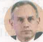
Hugo López-Gatell Subsecretario de Salud

"NUESTRAS decisiones se basan en el seguimiento regional diario que realizamos y es aún más restrictivo que el nacional. No tengo interés en realizar alguna propuesta porque mi semáforo es más restrictivo"