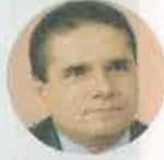
Silvano Aureoles Mandatario de Michoacán

"¿CUÁNTOS muertos más se necesitan para que el señor se vaya?, ¿qué más tendríamos que hacer quienes hemos dado la batalla desde los estados para demostrar que hemos estado solos?"