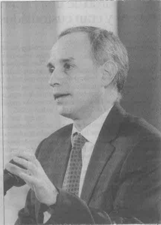
▲ Las diferencias son normales, dijo Sheinbaum sobre los desacuerdos con López-Gatell.