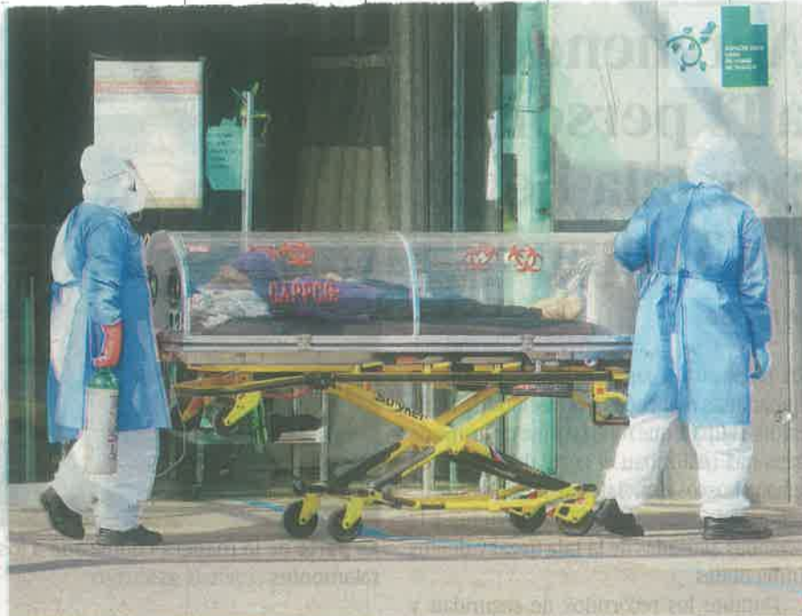
La Ciudad de México es la más afectada en contagios de Covid-19 en todo el país con 72 mil 343 casos