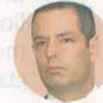
Alejandro Murat Gobernador de Oaxaca

"ESTOY SEGURO de que estos nueve gobernadores tienen diversos sentimientos ante la realidad. Son autoridades políticas y administrativas y su deber es cuidar la salud y economía de los estados y puede causar estrés"