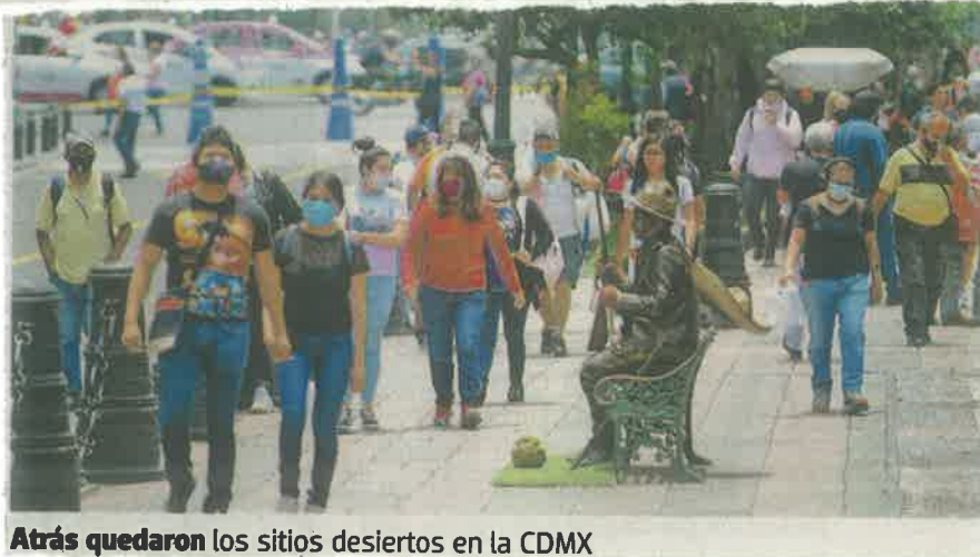
Atrás quedaron los sitios desiertos en la CDMX