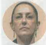
Claudia Sheinbaum Jefa de Gobierno de la CDMX

"RESPETO las posturas de mis compañeros gobernadores que integran la Alianza Federalista, pero preciso: Querétaro a la fecha no es parte de ella y, por lo tanto, no puedo suscribir sus posiciones"