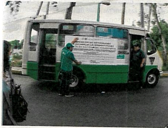
El 1 de julio terminó la primera fase de revisión