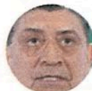
Luis C. Sandoval

Contundente discurso emitió ayer el titular de la Sedena, Luis Crescencio Sandoval , durante la ceremonia por el 110 aniversario de la Revolución Mexicana. En un par de ocasiones subrayó que las Fuerzas Armadas no "anhelan ningún poder", lo cual se leyó como un mensaje sólido de su lealtad al modelo democrático y civil de los Poderes de la Unión.