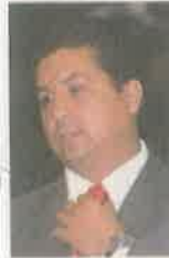
Francisco García Cabeza de Vaca

:::: Tan mal cayó en los grupos parlamentarios de la Cuarta Transformación la negativa del Congreso de Tamaulipas para desafuero al gobernador panista, Francisco Javier García Cabeza de Vaca , que circula en algunas mentes la idea de ir al Senado de la República a resolver este asunto. Nos cuentan que algunos integrantes de Morena barajan la posibilidad de solicitarle al Senado que desaparezca poderes en Tamaulipas y se nombre a un mandatario sustituto. Esta posibilidad es considerada un disparate por otros, quienes consideran que se debe esperar a que este asunto sea dirimido en una controversia constitucional en la Suprema Corte de Justicia de la Nación. Como decía el dicho revolucionario, muchos morenistas andan tan acelerados que primero quieren disparar y luego averiguar.