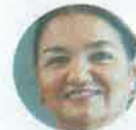
Dulce María Sauri

Se acabó prácticamente la XLIV Legislatura de la Cámara de Diputados, y la presidenta de la Mesa Directiva, Dulce María Sauri, enumeró los factores que la hicieron histórica. Fue la primera en equidad de género, en realizar sesiones a distancia por la pandemia, en la que sus integrantes podrán ser reelectos y, obvio, en tener nueva fuerza mayoritaria.