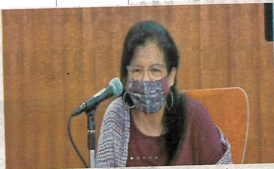
Nashieli Ramírez advirtió fundamental evitar la pandemia se convierta en un caos en derechos humanos

Informó además que no hay subejercicios y que, está comprometido al cien por ciento el presupuesto del presente año. Aclaró que en capítulo 3000 hay remanentes porque no se ha pagado el servicio de vigilancia de todo el año.