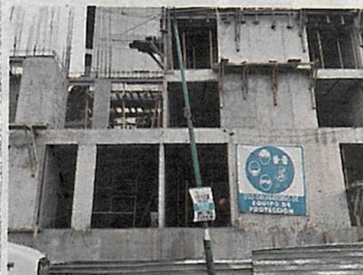
Irregularidades en construcciones, una norma