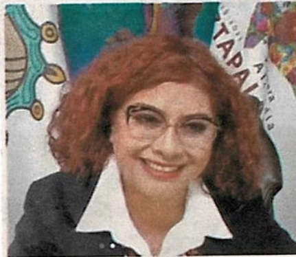
Se aplicarán pruebas Covid-19, para detectar casos en Iztapalapa