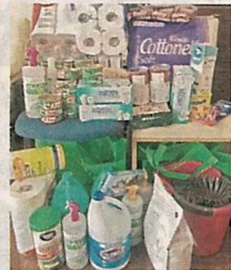
■ Los vecinos se organizaron para hacer la colecta.

/// La lluvia que duró horas dañó techos, son láminas de asbesto que llevan años en las casas, el agua se empezó a filtrar por los techos”.