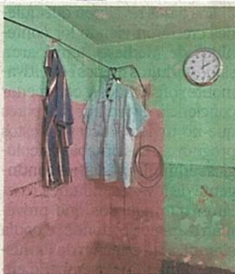
En las paredes de las casas se observa el nivel de la inundación.

agua alcanzó el metro de altura, mientras que en otras partes entre 42 y 72 centímetros; el líquido y lodo afectó los automóviles que estaban en un estacionamiento, refrigeradores, estufas, televisores, ropa y demás artículos del hogar de varias familias.