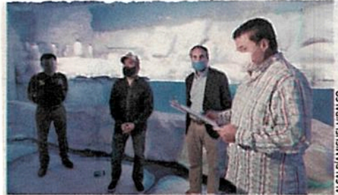
ALCALDÍA MIGUEL HIDALGO

RECORRIDO. En MH se supervisan las actividades reanudadas por seguridad de los ciudadanos.