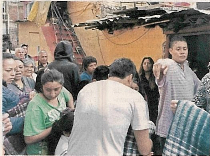
■ Habitantes de Coyoacán llevaron víveres y productos de limpieza a familias afectadas en Cuadrante San Francisco.