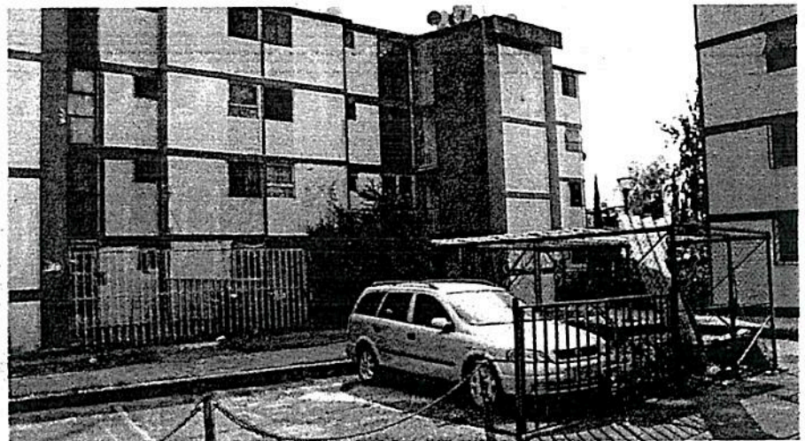
Piden al Congreso de la Ciudad de México a regular el mercado inmobiliario y los alquileres

Expuso que, en su caso, está en riesgo de ser expulsado del histórico edifi-