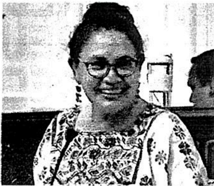
Mesa de trabajo Ordenamiento Territorial y Suelo para Vivienda Social

Notificó que al año en la capital del país se crean 38 mil familias, de las cuales 20 mil no tienen posibilidades de vivir aquí y tienen que buscar vivienda en Ecatepec, Huehuetoca, Zumpango o Tizayuca.