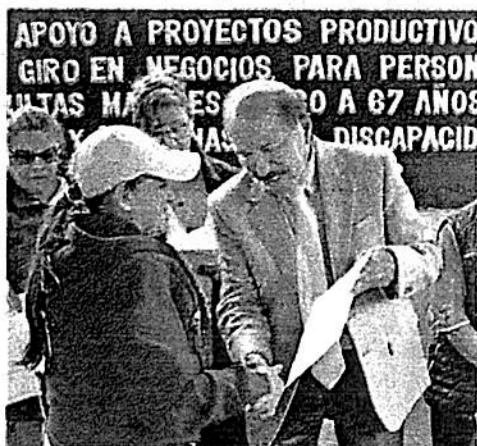
El alcalde de Iztacalco, Armando Quintero, durante la entrega de apoyos económicos

Durante la ceremonia el alcalde compartió a los asistentes que con este tipo de acciones se va a mejorar la calidad de vida y destacó que Iztacalco redujo durante cinco meses consecutivos la incidencia delictiva.