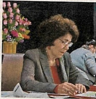
VIRTUAL. Aceves se reunió con la Comisión de Presupuesto del Congreso de la Ciudad de México.

Aceves pidió un aumento de 3% al Presupuesto 2021 de la demarcación, que sea acorde con la inflación y su territorio, pues es la alcaldía más grande de la capital. /24HORAS