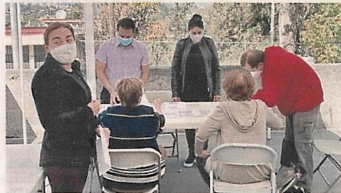
■ La Alcaldía Miguel Hidalgo organizó una consulta vecinal sobre la restricción de accesos en la Colonia Lomas de Bezares.