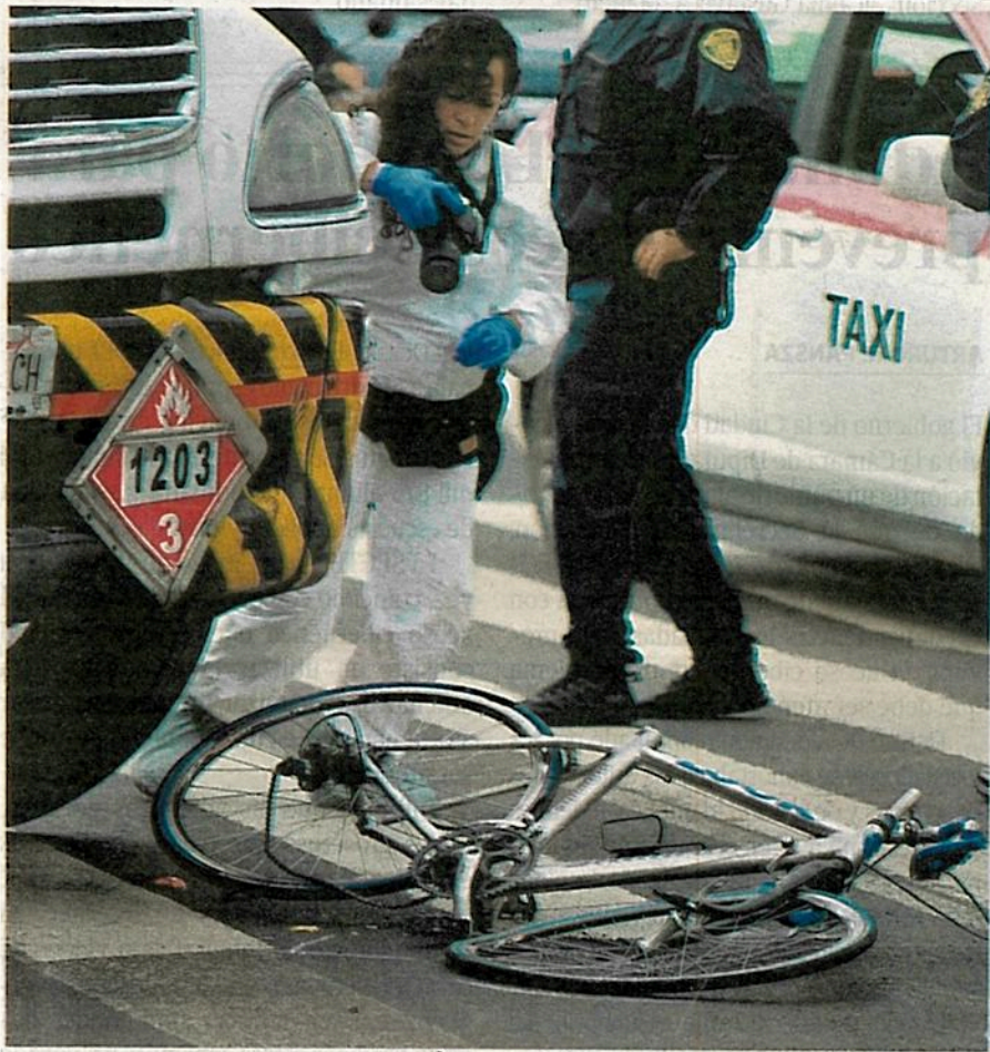
Promueven evitar más defunciones de ciclistas y peatones