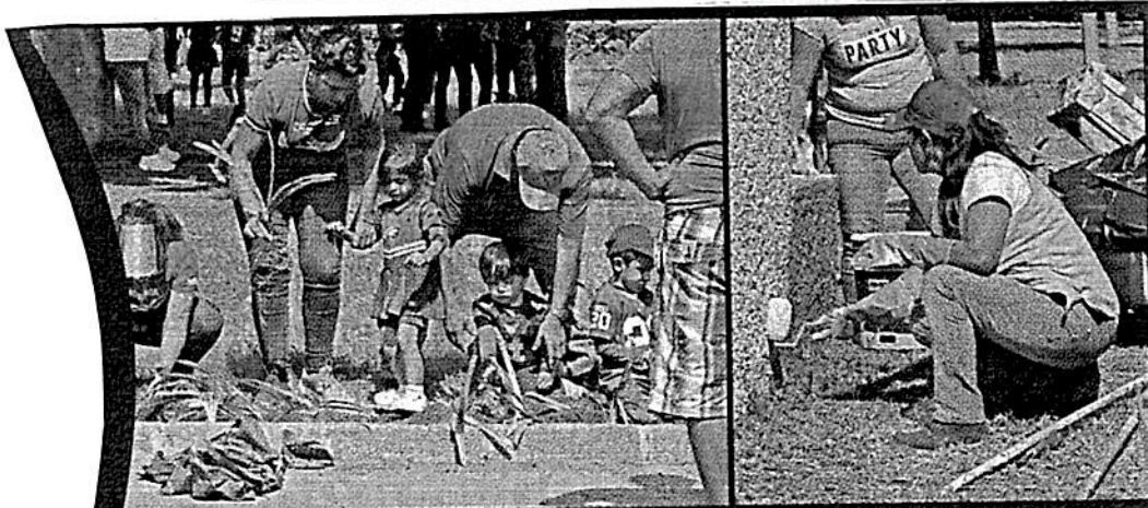
■ En las 12 hectáreas intervenidas se recogieron 40 toneladas de desechos orgánicos y basura.

“Fueron más de seis años de no darle atención, las áreas que no fueron privatizadas presentan mayor abandono” recalzó Quintero.