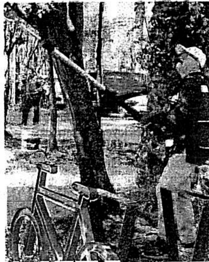
El anterior mantenimiento quedó a deber, consideró el alcalde

presenta mal estado, las regaderas, sanitarios y el gimnasio de box, se rehabilitarán la próxima semana.