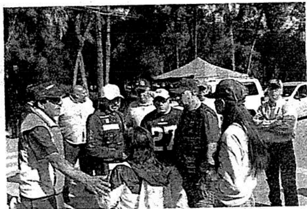
Al menos mil personas se dedicaron a limpiar la Ciudad Deportiva

La alberca que presenta mal estado, las regaderas,