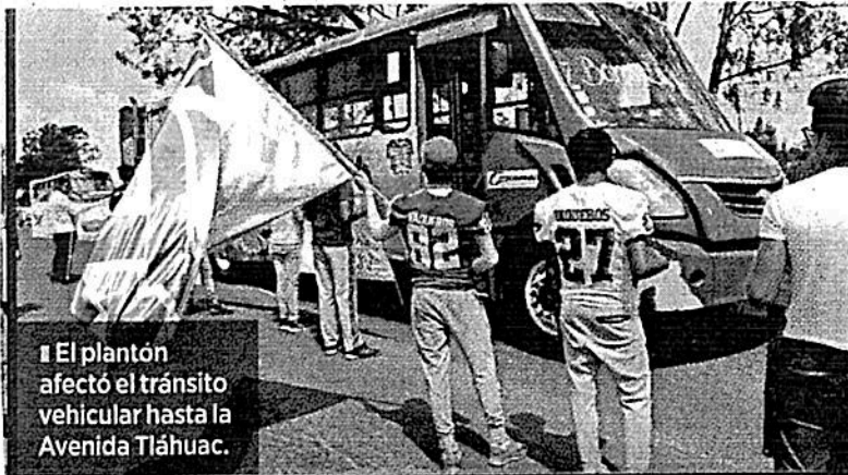
El plantón afectó el tránsito vehicular hasta la Avenida Tláhuac.