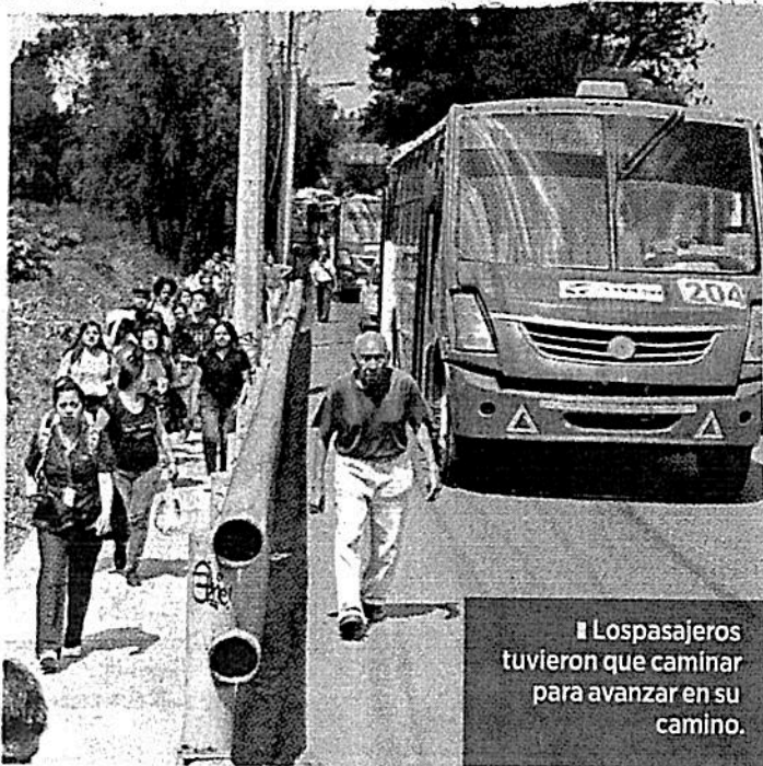
Los pasajeros tuvieron que caminar para avanzar en su camino.