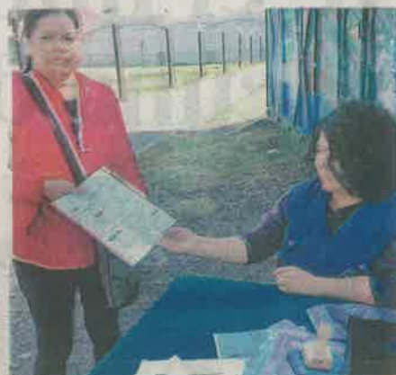
Las Copacos son las figuras de representación ciudadana que tendrán los vecinos en la CDMX

Informó que la función de las Copacos, que reemplazarán a los actuales Comités Ciudadanos y Consejos de los Pueblos, es representar a la ciudadanía ante las autoridades de las alcaldías y del gobierno capitalino, a efecto de promover acciones en beneficio de las colonias, barrios y pueblos originarios de la capital.