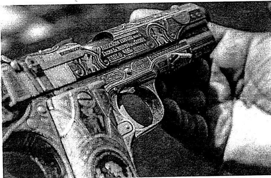
Mujeres cada vez buscan la manera de como portara arma por falta de seguridad

De acuerdo con la comisionada, las mujeres han tomado la decisión de portar un arma para uso de defensa personal, "lo que se traduce en un grito de auxilio porque no hay resultados en el tema de seguridad".