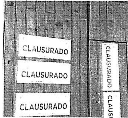
Algunos complejos no pueden continuar las obras

Expuso que la obra de "Playa Miramar 386", Colonia Reforma Iztaccíhuatl, fue sujeta a clausura definitiva toda vez que