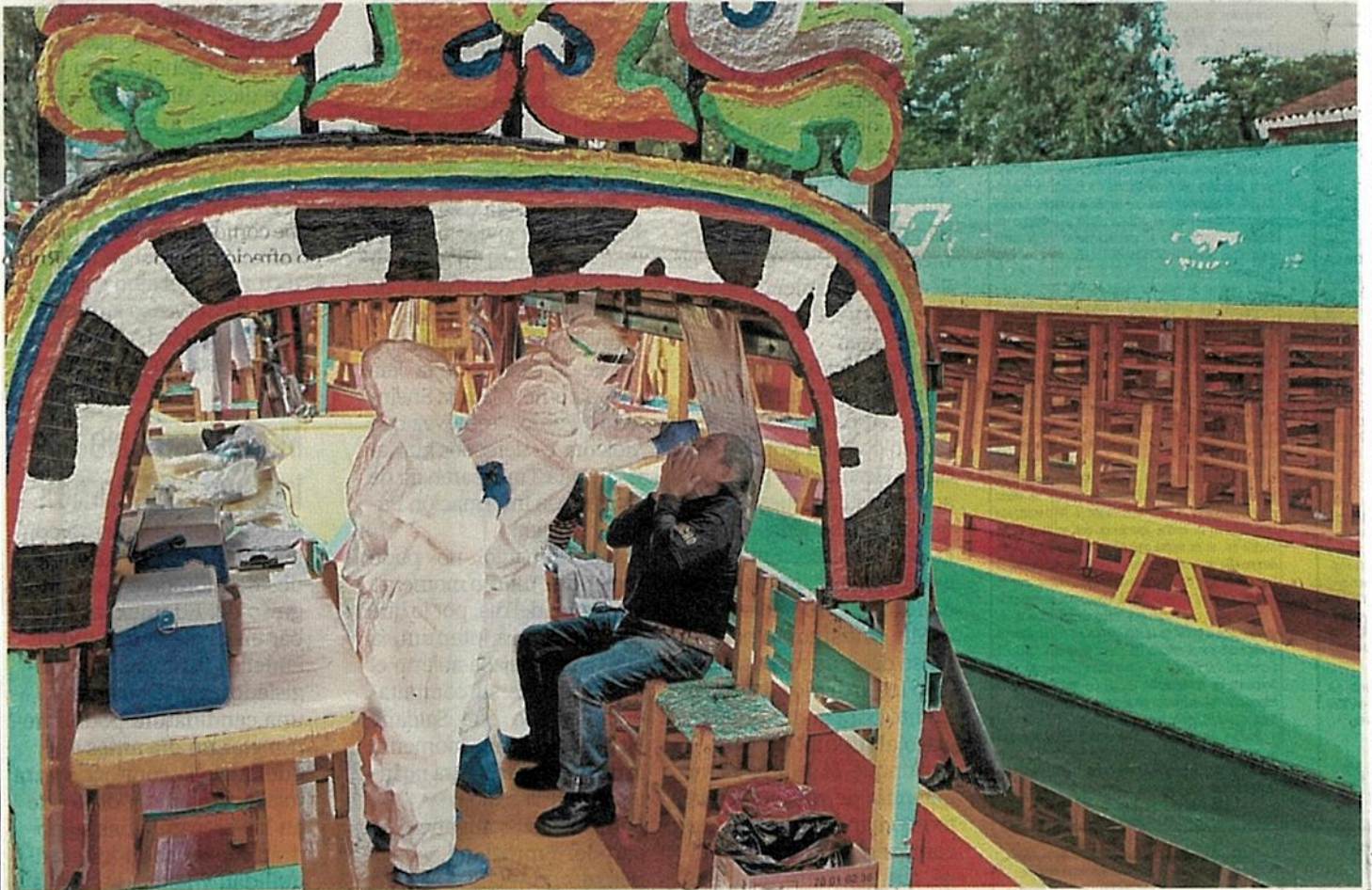
En los embarcaderos recién abiertos al público se aplicaron pruebas PCR y a prestadores de servicios les enseñaron a sanitizar sus trajineras.