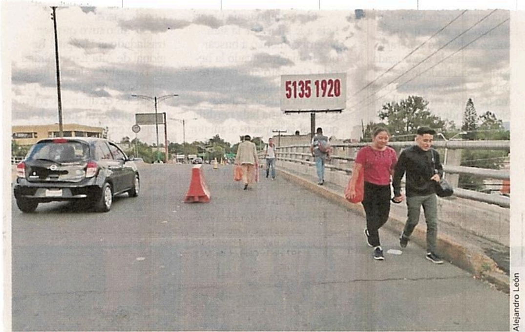
MÁS ESPACIO. Ciclistas y peatones aprovecharán uno de los carriles del puente.