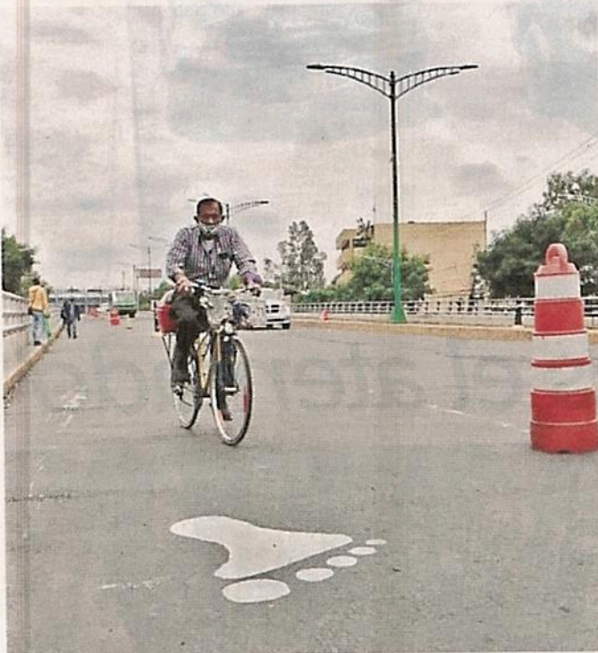
El riesgo para cruzar Tlalpan era alto por la falta de acera.