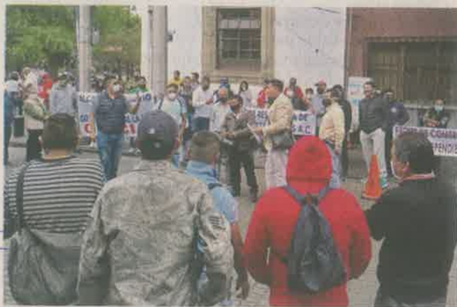
El jueves, tianguistas se manifestaron frente a la sede de la Alcaldía ubicada en el centro por el conflicto.