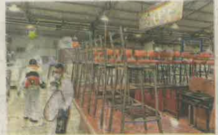
La alcaldía Azcapotzalco no bajará la guardia mientras la ciudad permanezca en semáforo rojo

Asimismo, informó que desde el 4 de junio y hasta el 16 de junio se realizarán jornadas de sanitización en los 21 mercados de la alcaldía, en diversas colonias y espacios públicos que así lo han solicitado.