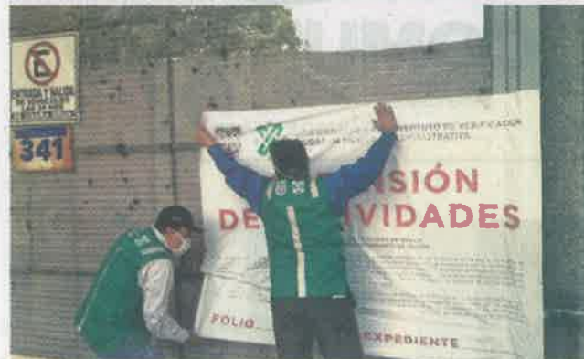
ARMADORA DE BICICLETAS