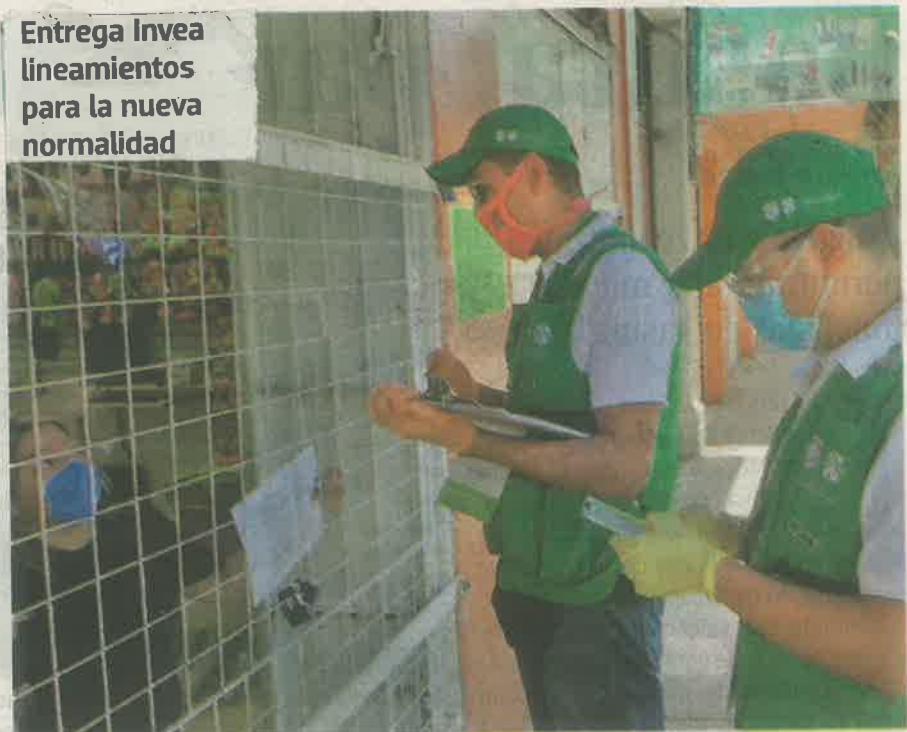
Personal del Invea continúa con las labores de revisión a establecimientos para verificar que atiendan las medidas sanitarias en la nueva normalidad

Entrega Invea lineamientos para la nueva normalidad