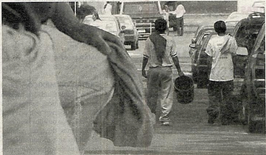
Franeleros cobran de 20 a 100 pesos, según la zona, el horario y el día

A pesar de los operativos contra franeleros en la alcaldía Cuauhtémoc, datos de la Secretaría de Seguridad Ciudadana (SSC) y de la misma demarcación revelan que esa situación fue una constante a afrontar por automovilistas durante 2022 en toda la demarcación a cargo de Sandra Cuevas. Casos por estas situaciones llegaron hasta 105 en algunos periodos y se contabilizaron 2.44 sujetos al día, en promedio, dedicados a apartar lugares.