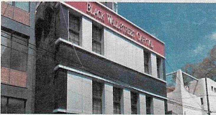
Edificio de Black WallStreet Capita.