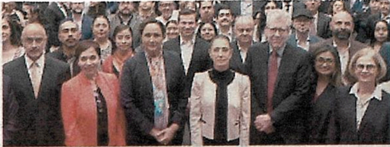
Con representantes de las Naciones Unidas