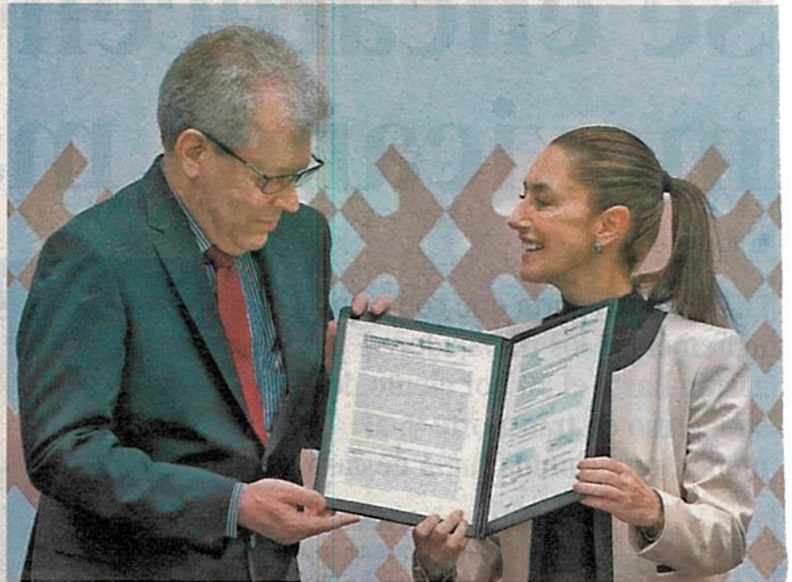
La jefa de gobierno firmó el Compromiso Global por la Nueva Economía del Plástico del Programa de Naciones Unidas para el Medio Ambiente

La Jefa de Gobierno, Claudia Sheinbaum Pardo, recordó que cuando entraron al Gobierno en acuerdo unánime con todo el Congreso de la Ciudad de México firmaron el cambio a la ley para eliminar los plásticos de un solo uso.