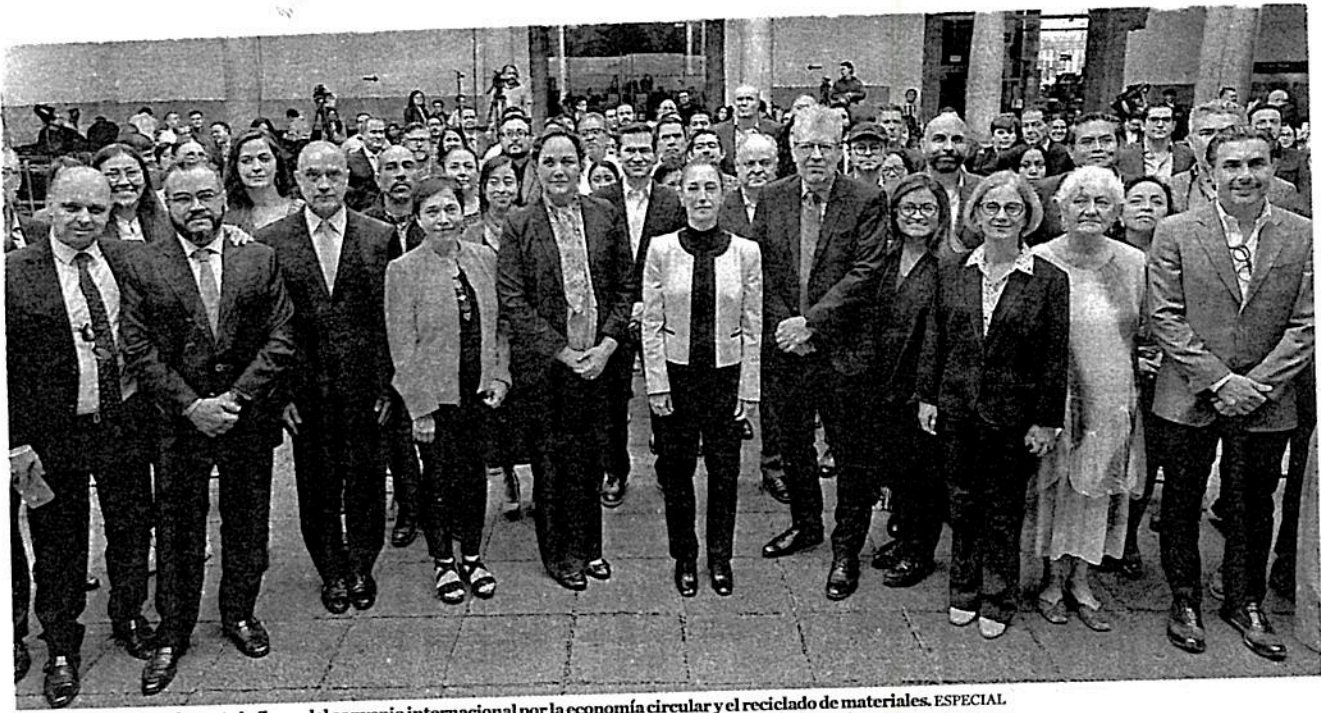
La jefa de Gobierno durante la firma del convenio internacional por la economía circular y el reciclado de materiales. ESPECIAL