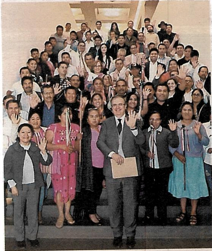
El canciller con autoridades de la mixteca de Oaxaca.