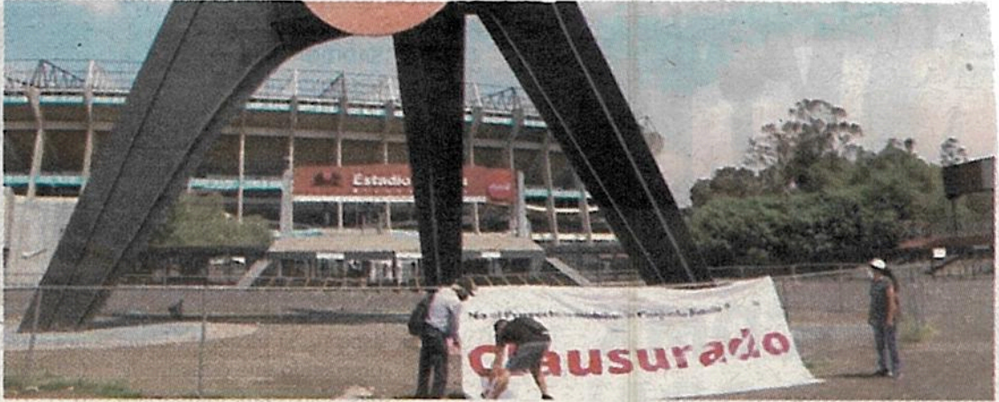
Vecinos de los Pedregales se oponen

Marcharon el pasado lunes sobre algunas arterias viales hasta llegar al estadio Azteca