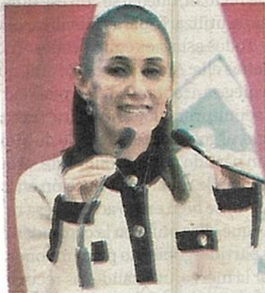
Va por certificación internacional

Llama a no consumir productos con agroquímicos