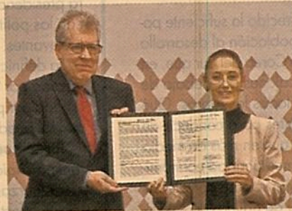
La capital del país ratifica su liderazgo en la agenda ambiental, al unirse al Programa de las Naciones Unidas para el Medio Ambiente.

Claudia Sheinbaum explicó que, entre las metas a lograr, destacan promover la eliminación de nuevos envases y productos de plástico no necesarios; fomentar la adopción de modelos de reutilización donde sea aplicable para reducir la demanda de envases; incentivar el uso de envases de plástico reutilizables, reciclables o compostables; aumentar las tasas de recolección, clasificación y reci-