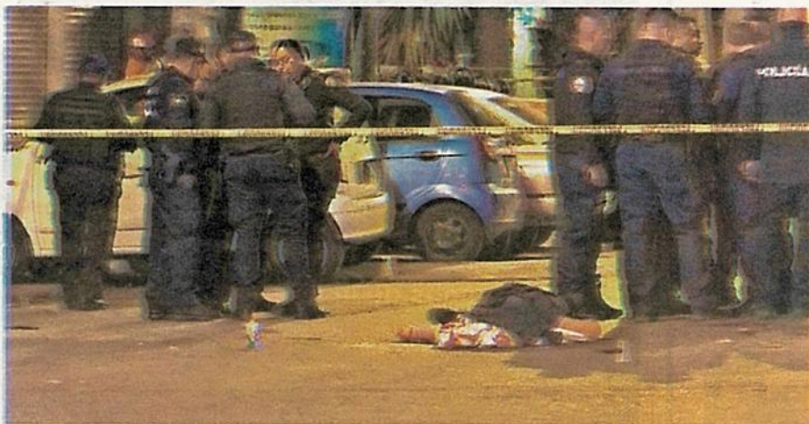
Las oscuras calles fueron el cómplice perfecto para que sujetos armados los asecharan desde las sombras esperando el momento para atacarlos

Una mujer de 20 años de edad con impacto en la pierna izquierda tercio medio del fémur, por lo que fue trasladada a un