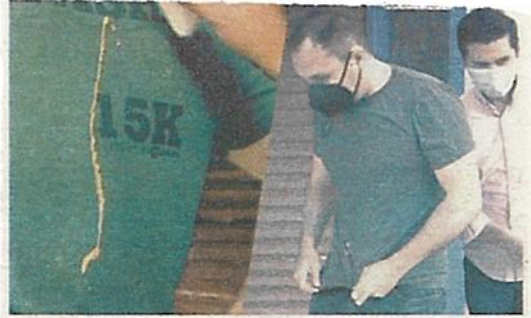
Manchan la ropa y se acercan a ayudar

Usan líquidos para manchar la ropa y acercarse a la víctima para ofrecer ayuda