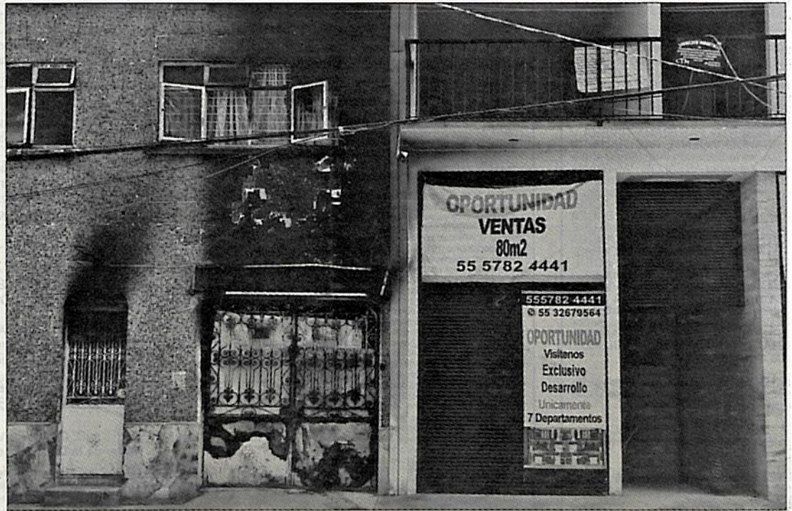
► Familias que habitan el inmueble de la calle Elisa 90, colonia Nativitas, vieron afectado su patrimonio por el incendio que provocó un corto circuito en una obra contigua.

en estas condiciones a sus vecinos”. Cravioto advirtió que si en siete días las autoridades no clausuran la obra de siete departamentos, los vecinos harán una clausura simbólica “para que la empresa vea que no puede estar trabajando, porque lo que me dicen los vecinos es que a raíz del incendio han acelerado los trabajos para acabar lo más pronto posible y lavarse las manos”.