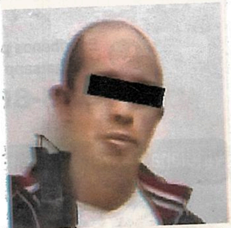
Se detuvo a un hombre de 30 años al cual al revisarlo se le encontró un arma de fuego

Posteriormente, en el hospital se presentó una mujer en una motoneta, donde llevaba a su hermano de 16 años de edad, el cual también había resultado herido en el mismo sitio y presentaba diversas lesiones por arma de fuego en antebrazo, brazo derecho y la cabeza.