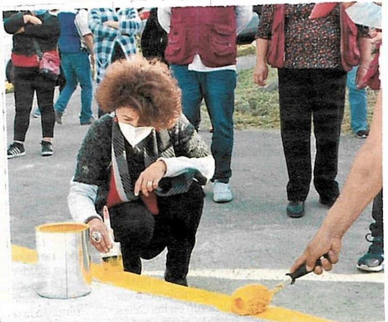
AVANCES. Aceves ha impulsado la recuperación de espacios públicos.

• Además, se instalaron seis mil luminarias con tecnología led.