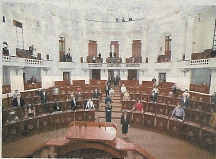
En el Congreso local, Morena, PAN y PRD reciben 20.8 millones de pesos para pagar a mil 58 asesores y empleados por honorarios.

De ese total, tan sólo Morena, PAN y PRD (con 34, 11 y cuatro diputados locales, respectivamente) reciben 20 millones 871 mil 536 pesos para pagar a mil 58 asesores.