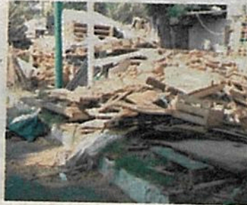
Así lucen las calles de la zona

CIUDAD DE MÉXICO. —Ante la incapacidad para poner freno a los grupos que se apoderan de la alcaldía de Iztacalco, vecinos de la colonia Santiago denuncian que esta zona de ha convertido en un auténtico nido de corrupción, ladrones y tiradero de ba-