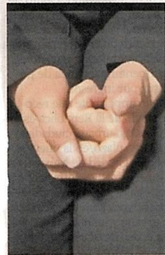
La denuncia fue difundida a través de un video de redes sociales.

De acuerdo con la SSC, la policía fue citada para presentar una declaración y ampliar los detalles sobre los hechos. No se especificó si la agente presentó una denuncia ante la Fiscalía General de Justicia (FGJ) de la Ciudad de México.