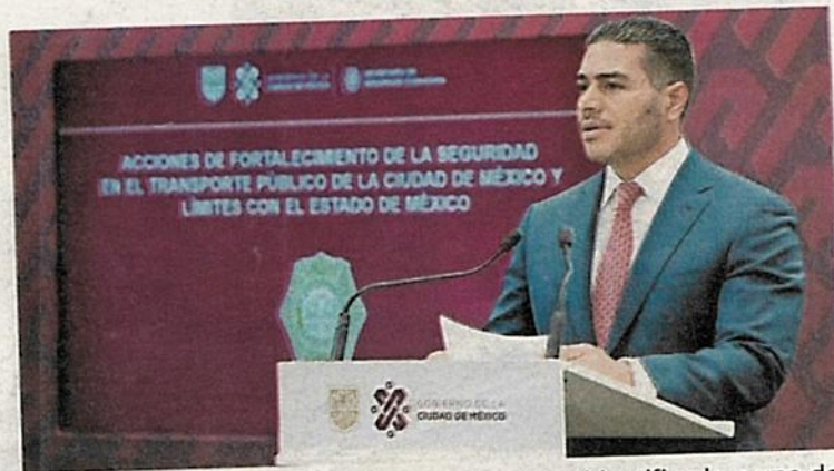
Omar García Harfuch informó que ya se tiene identificado a uno de los que balearon a una pareja y a un policía en Tlalpan

L a célula que asesinó la tarde del miércoles a un civil y a un elemento de la Secretaría de Seguridad Ciudadana en calles de la Alcaldía Tlalpan se dedica a delinquir en Nezahualcóyotl, Estado de México, y en la capital del país, confirmó el