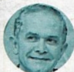
MIGUEL ÁNGEL MANCERA

› La cuarta reunión plenaria de Morena, que arranca hoy en el Congreso de la Unión, será el escenario ideal para explicar lo que se ha hecho en la Ciudad de México, declaró Claudia Sheinbaum , quien tiene cita a las 12:30 horas en el recinto legislativo. Con esa confianza, nos hacen saber, llega la jefa de Gobierno al Salón Aurora de la Cámara de Diputados, en donde todo mundo espera un encuentro cordial y en pro de la unidad del partido mayoritario.