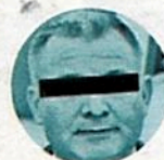
GENARO GARCÍA LUNA