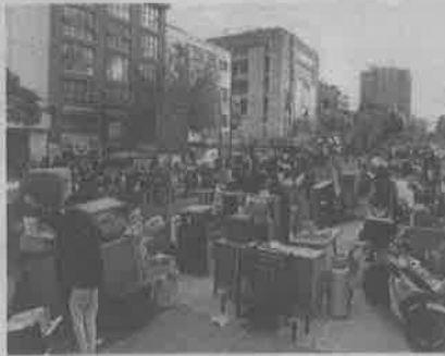
El 13 de diciembre de 2018, se llevó a cabo un desalojo en la colonia Centro.

En el documento, la titular de la CDH local propone que, en caso de que un inquilino no pueda pagar la