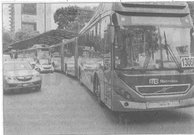
▲ Autoridades realizan trabajos de ampliación de la línea 3 del Metrobús de Etiopía a Río Churubusco.

El Sistema Metrobús informó que con la ampliación de la línea, que da servicio a 200 mil personas en días hábiles, espera mover a 10 mil personas más “y generar una demanda de 20 mil viajes adicionales de usuarios que salgan del Metro. En total podría mover a 30 mil personas más de las que movemos actualmente en la línea 3, para llegar a 230 mil personas al día”.