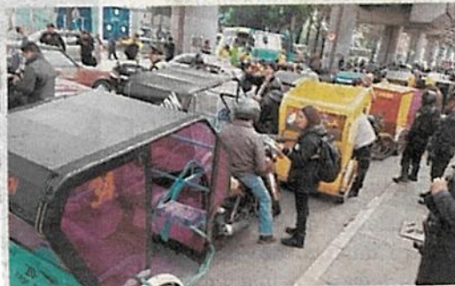
• Los pondrán en orden

• Dueños de unidades deberán escanear documentos personales, de legalidad y de las organizaciones a las que pertenecen